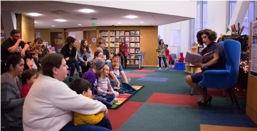
Drag Queen Märchstunde (3), 31.1.2019

nahmen, Ukraine-Krieg [14] oder eben Drag Queen-Lesungen für Kinder.