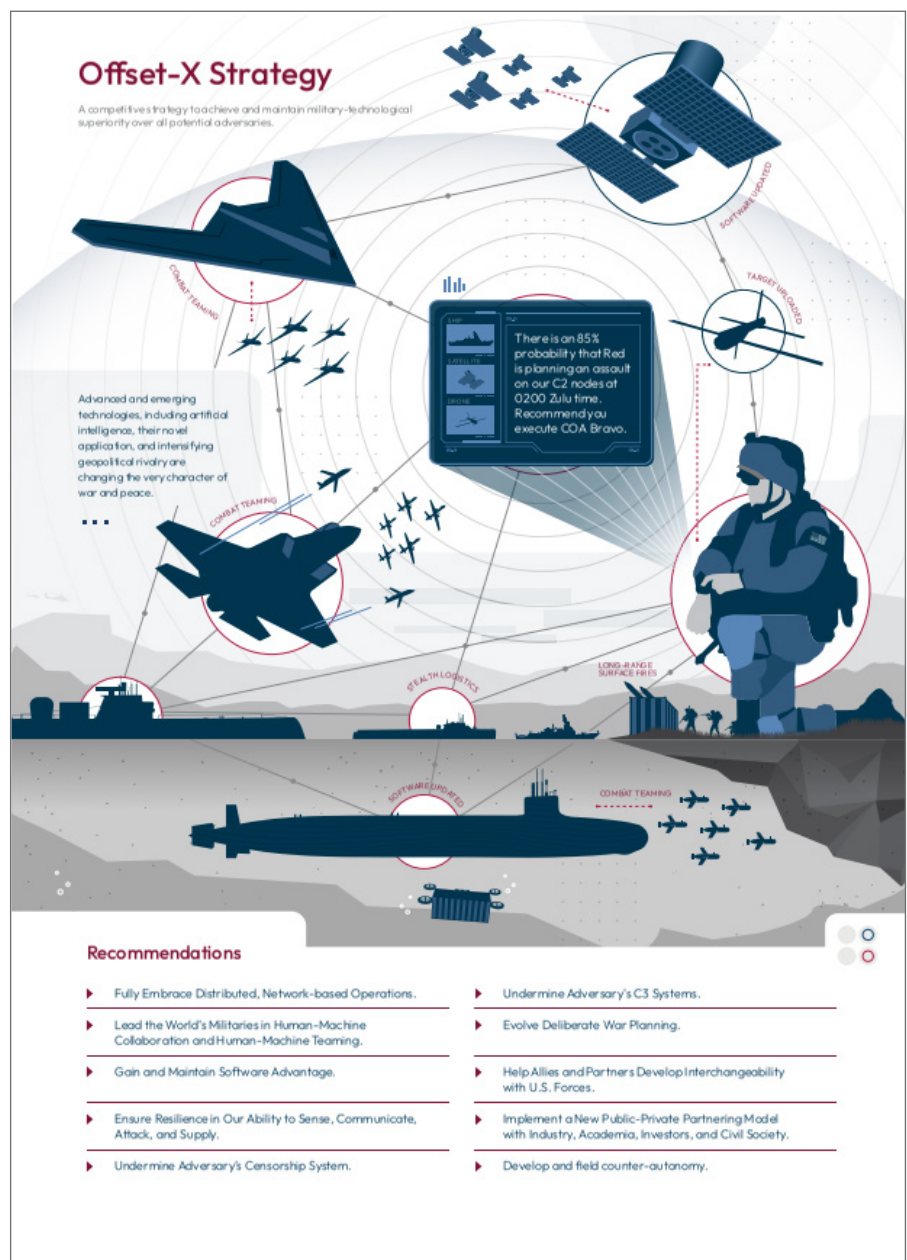
Mit der Offset-X Strategy versuchen die USA ihre militärisch-technologische Dominanz zu behalten.

Mit größter Intensität sollen die „zivilgesellschaftlichen“ Organisationen in fremden Ländern bearbeitet werden, um