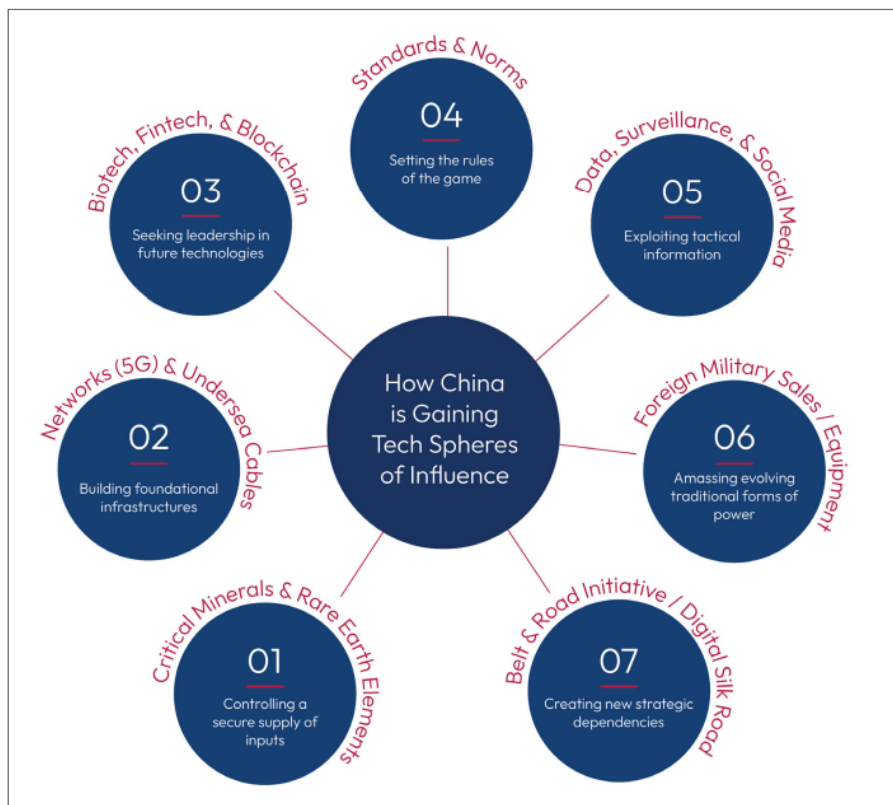
Chinas Einfluss-Tech-Sphären, laut SCSP.

Der Bericht des SCSP lässt keinen Zweifel an der zentralen Rolle der IT-Konzerne und Plattformen für die staatliche Machtausübung: