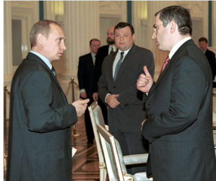
DER KREML, MOSKAU. Präsident Wladimir Putin mit Michail Chodorkowski, CEO des Ölkonzerns Yukos, 31.5.2001.

Zurück zu Prigoschins Putschversuch: In seiner Rede am Morgen des Putschtags bestätigte Putin die Blockade wichtiger Objekte in der südrussischen Stadt Rostow am Don durch die Söldnertruppe: „Faktisch ist die Arbeit von Organen der zivilen und militärischen Führung blockiert“ [18]; er rief zur „Einigkeit“ auf