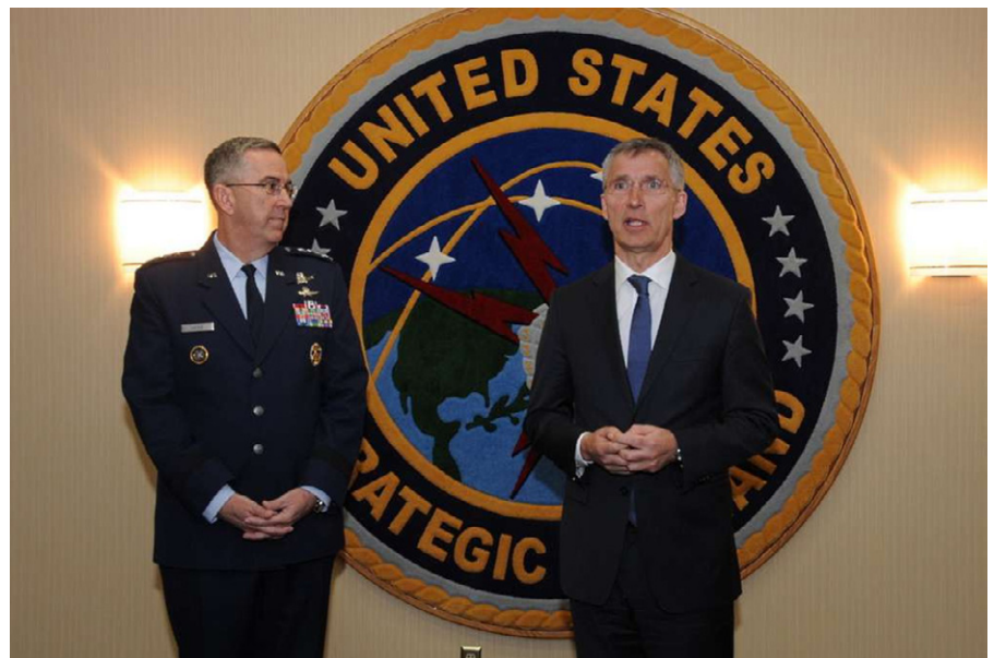
NATO-Generalsekretär Jens Stoltenberg spricht am 6. April 2018 mit dem Kommandeur des US Strategic Command (USSTRATCOM), General John Hyten, vor den Medien im USSTRATCOM-Hauptquartier auf dem Luftwaffenstützpunkt Offutt, Neb. Während seines Besuchs besichtigte Stoltenberg das globale Operationszentrum des Kommandos und nahm an Diskussionen mit Hyten, anderen hochrangigen Führungspersönlichkeiten und Fachexperten über das fortgesetzte Engagement der USA zur Unterstützung der NATO und ihrer Verbündeten teil.

US-Geheimdienste gehen einem Bericht zufolge davon aus, dass Wagner-Chef Jewgeni Prigoschin bereits seit einiger Zeit Vorbereitungen für eine Aktion gegen die russische Militärführung getroffen hat [28]. Erste Hinweise auf ein geplantes Vorgehen Prigoschins gegen die Militärführung hatten die Geheimdienste der „Washington Post“ zufolge bereits Mitte des Monats. Wenige Tage vor dem Putsch hätten sich die Hinweise dann derart verdichtet, dass es in Washington eine Reihe von Geheimdienstbriefings gab, hieß es in der „New York Times“ [29].