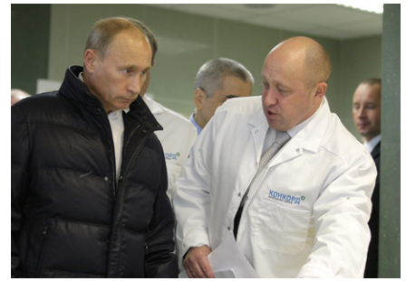
Premierminister Wladimir Putin, hier mit Inhaber Prigoschin, besichtigt die neue Fabrik Concord, die Schulen mit Fertiggerichten beliefert, 20.9.2010.

Prigoschin in der Nachfolge von Lenin und Trotzki?