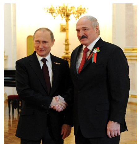
Vor Beginn des informellen Treffens der Staatsoberhäupter der GUS. Wladimir Putin mit dem Präsidenten von Belarus, Alexander Lukaschenko, 8.5.2015.

Am frühen Abend des 1. Putschtages kam die Überraschung: Prigoschin stoppt den Marsch auf Moskau, lässt umdrehen und die Feldlager wieder beziehen.