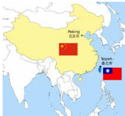
Kina ser Taiwan som en del af Folkerepublikken. "Ét Kina-Politikken" er internationalt anerkendt.

Et kig på et hvilket som helst kort over USA's militære faciliteter i "Indo-Pacific"-regionen viser, at Kina praktisk talt er omringet af USA's militær via Sydkorea, det japanske fastland, Okinawa og med