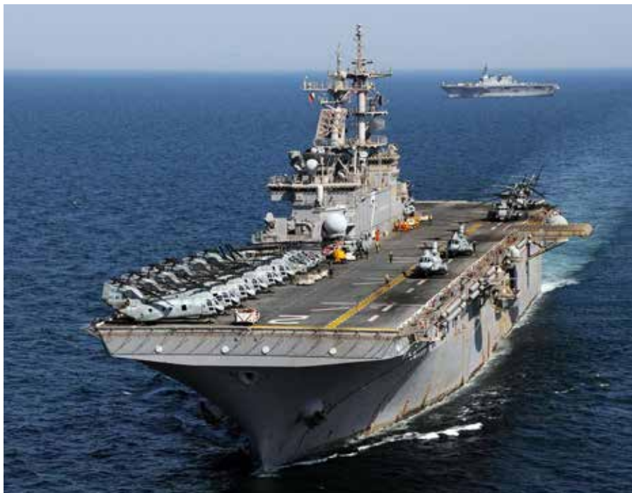
USS Essex (LHD 2) sejler ud for Japans nordøstlige kyst med JS Hyuga (DDH 181).

En potentiel krig mellem USA og Kina vil, hvis den finder sted, blot være det seneste eksempel på USA's militære aggres-