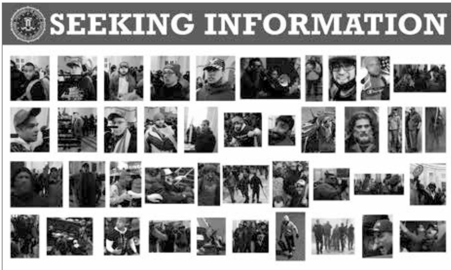
FBI-Plakat zur Suche nach Informationen über die Gewalt im US-Kapitol am 6. Januar 2021.

und begrüßte den Verweis der USA auf die Budapester Konvention und deren zweites Protokoll als ‚Goldstandard‘. In einer kurzen Präsentation von Eurojust wurde die laufende Zusammenarbeit im ANOM-Fall hervorgehoben, wobei ein ‚Sperrbereich für die Fallbearbeitung‘ eingerichtet wurde, der es Staatsanwälten ermöglicht, nicht-sensible Informationen über Fälle und Gerichtsentscheidungen auszutauschen.