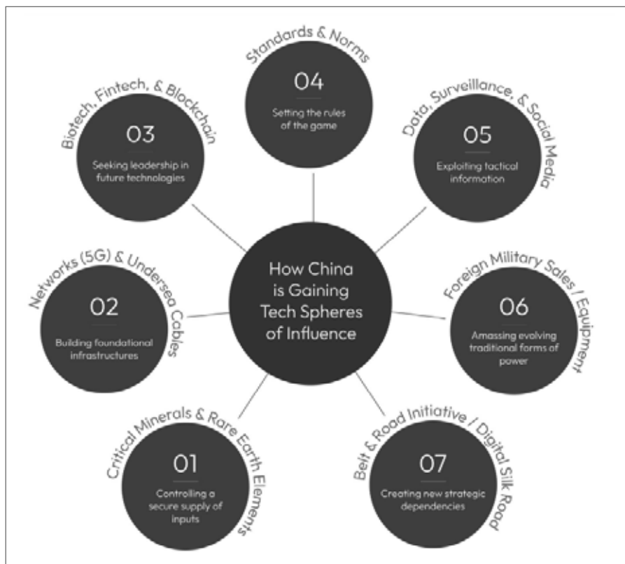
Chinas Einfluss-Tech-Sphären, laut SCSP. (Grafik: Screenshot aus dem SCSP-Final Report [8])

Der Bericht des SCSP lässt keinen Zweifel an der zentralen Rolle der IT-Konzerne und Plattformen für die staatliche Machtausübung: