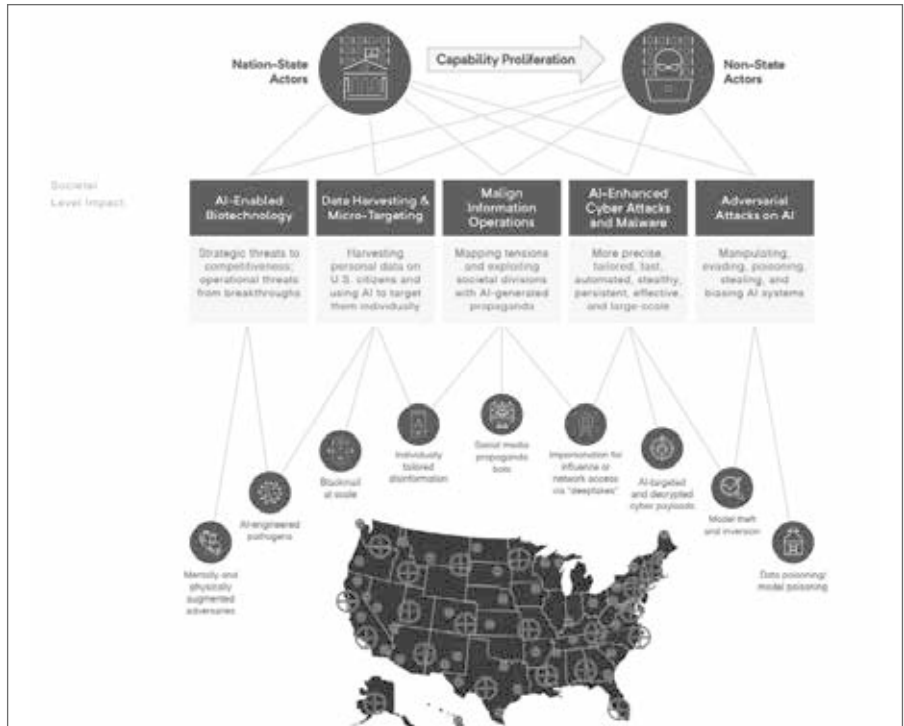
Laut NSCAI Bericht sind dies die KI-Gefahren die von China ausgehen. (Grafik: Screenshot aus dem NSCAI-Final Report, [5])

Dieser Text wurde zuerst am 26.06.2023 auf www.norberthaering.de veröffentlicht. Lizenz: © Norbert Häring