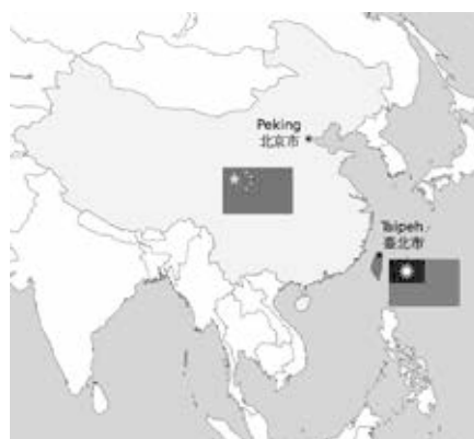
Kina ser Taiwan som en del af Folkerepublikken. "Ét Kina-Politikken" er internationalt anerkendt.

Et kig på et hvilket som helst kort over USA's militære faciliteter i "Indo-Pacific"-regionen viser, at Kina praktisk talt er omringet af USA's militær via Sydkorea, det japanske fastland, Okinawa og med