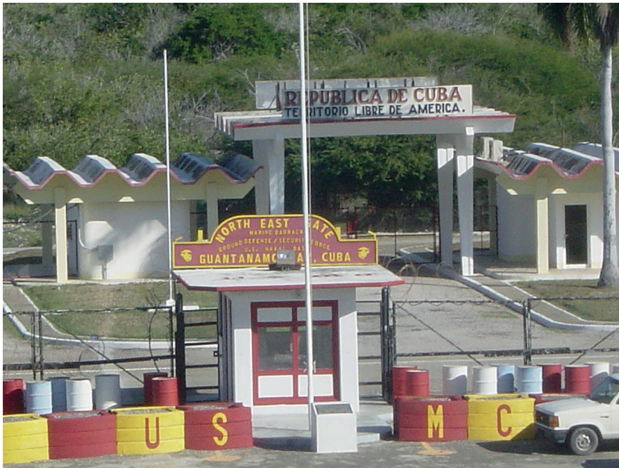
North East Gate, Guantanamo Bay Cuba

ges gegen den Terror“. Seine gesamte Geschichte hat ihre Wurzeln im Kolonialismus und der Missachtung des Völkerrechts.