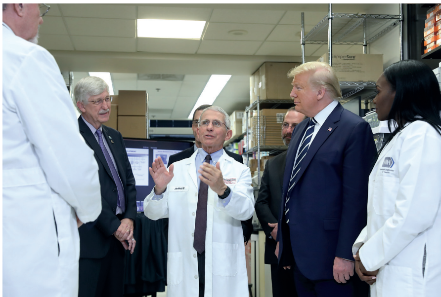
Präsident Donald J. Trump besichtigt am Dienstag, 3. März 2020, das Labor für virale Pathogenese an den National Institutes of Health in Bethesda, Md.

Am 17. Oktober 2014 verkündete die Obama-Regierung nach einem Unfall