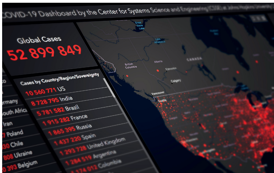
Das Corona Dashboard

[37] Reuters, "Fact Check-2015 Nobel Prize for ivermectin intended for treatment of parasitic infections doesn't prove its efficacy on COVID-19" am 09.09.2021 < https://www.reuters.com/article/factcheck-nobel-ivermectin-idUSL1N2QB2XA >