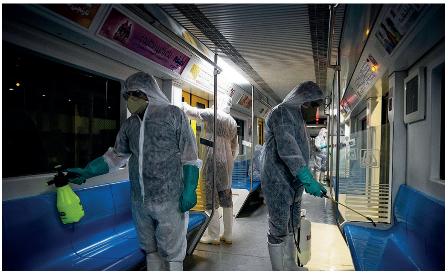
Desinfektionsteam beim Desinfizieren einer U-Bahn.