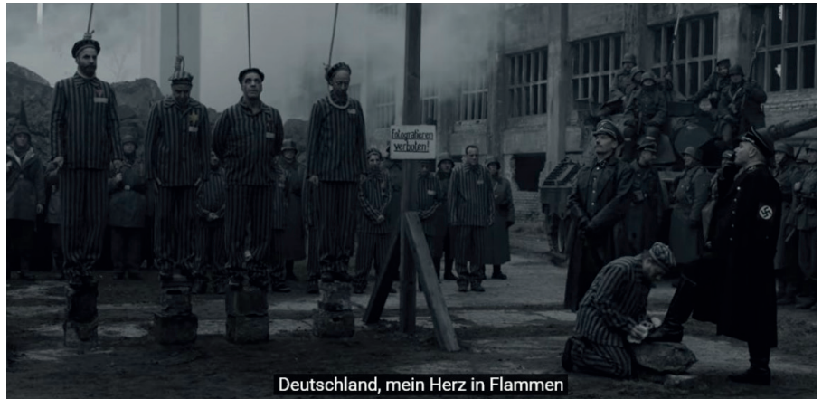
Bild 2: Screenshot aus dem Musikvideo der Gruppe Rammstein "Deutschland"