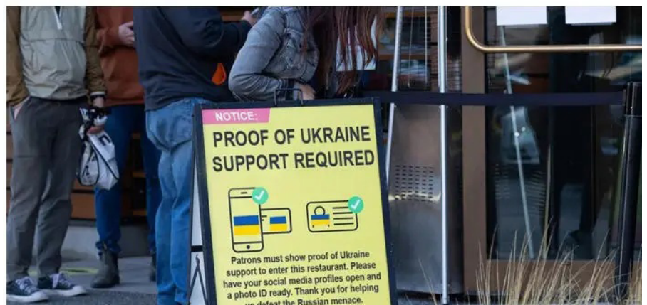
Abb. 2: „Nachweis der Unterstützung der Ukraine erforderlich für den Zutritt“.