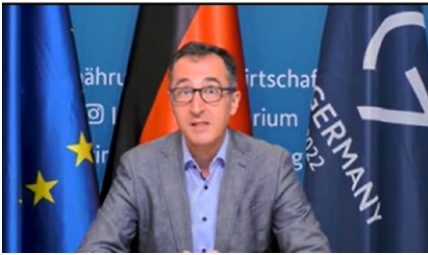
Bundesminister Cem Özdemir stellt die Ernährungsstrategie der Bundesregierung vor. (Screenshot: https://www.youtube.com/watch?v=YnblzMv6PII )

leichtert werden kann, muss mit besonderer Priorität adressiert werden. Denn auch in einem reichen Land wie Deutschland existiert Ernährungsarmut. Multiple Krisen wie die Covid-19-Pandemie, der russische Angriffskrieg gegen die Ukraine sowie Klimawandel und Artensterben verstärken dieses Problem u. a. durch Preissteigerungen und Lieferengpässe, die insbesondere finanzschwache Bevölkerungsgruppen treffen. Sie legen auch die Vulnerabilität und Abhängigkeiten des heutigen Ernährungssystems offen.“ (S. 2; meine Hervorhebungen)