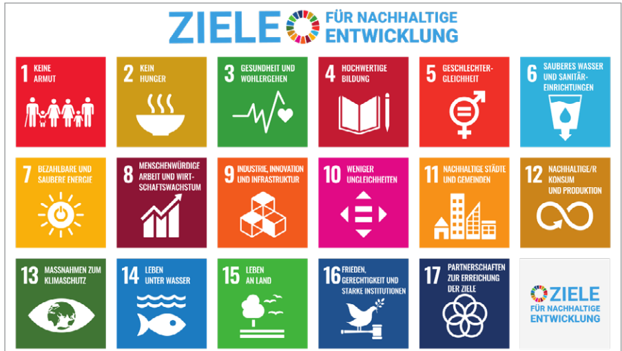
Ziele für nachhaltige Entwicklung des UN Development Program.

Dieser Text wurde zuerst am 24.05.2023 auf www.tkp.at unter der URL https://tkp.at/2023/05/24/gruene-plaenen-ernaehrungswende-mit-potenziell-katastrophalen-folgen/ veröffentlicht. Lizenz: Assoc. Prof. Dr. Stephan Sander-Faes, tkp, CC BY-NC-ND 4.0