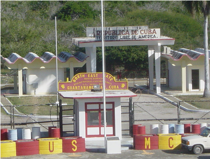
North East Gate, Guantanamo Bay Cuba

ges gegen den Terror“. Seine gesamte Geschichte hat ihre Wurzeln im Kolonialismus und der Missachtung des Völkerrechts.