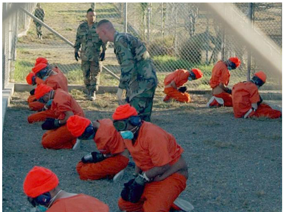
Gefangene bei ihrer Ankunft im Januar 2002

Es gibt immer noch viele Dinge, welche die Öffentlichkeit nicht über Guantánamo Bay weiß. Es gibt immer noch geheime Akten über Foltermethoden. Ebenso erschreckend ist, dass noch niemand für die zahlreichen Menschenrechtsverletzungen in dem Folterlager zur Rechenschaft gezogen wurde.