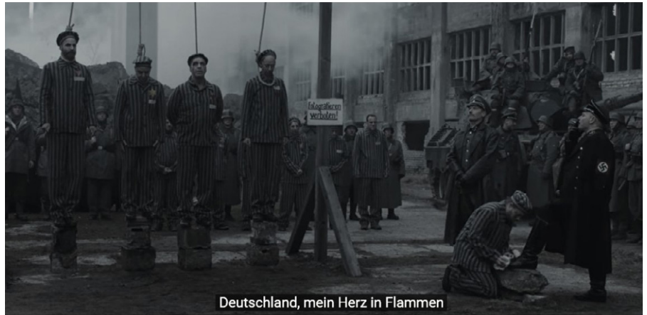
Bild 2: Screenshot aus dem Musikvideo der Gruppe Rammstein "Deutschland"