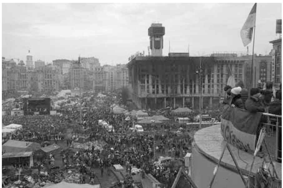
Maidan von oben, 24.2.2014

Aber wir haben anerkannt, dass die Ukraine ein souveräner Staat ist und ihr