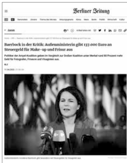
(Screenshot: https://www.berliner-zeitung.de/news/steuergelder-baerbock-gibt-137000-euro-fuer-maskenbildner-aus-li.337101 )