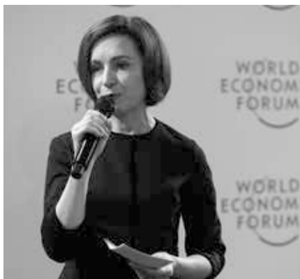
Maia Sandu, Präsidentin der Republik Moldau, spricht in der Sitzung „Dialogue>Dinner: European Leadership in a Fragmented World“ auf der Jahrestagung des Weltwirtschaftsforums in Davos, 18.1.2023.

Können sie sich das vorstellen? Ich will den Deutschen das klarmachen. Stellen Sie sich vor, dass ein französischer Staats-