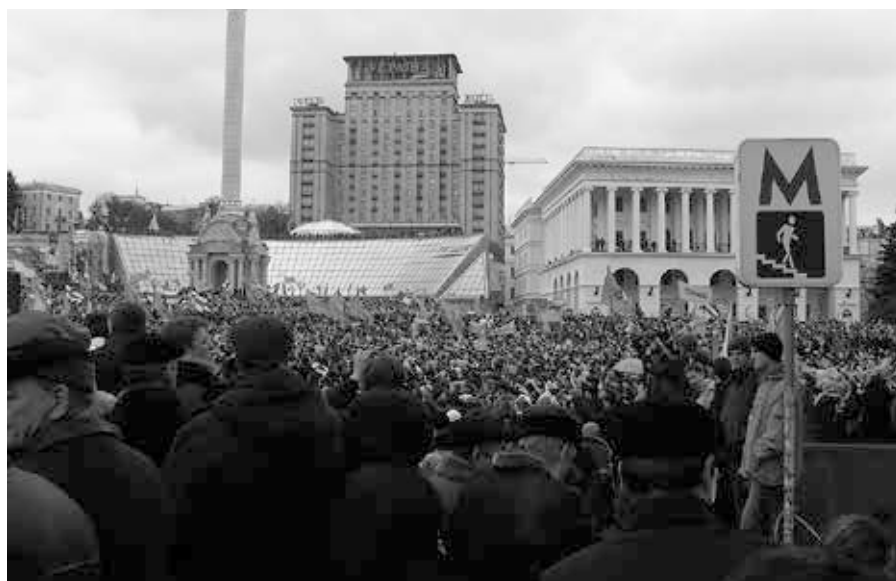
Orange gekleidete Demonstrationsteilnehmer in Kiew, November 2004.

Der Mann, der von den südöstlichen und östlichen Regionen der Ukraine, wo die Bevölkerung hauptsächlich, ich weiß nicht, russischsprachig oder pro-russisch ist, die Jahrhunderte mit Russland und der