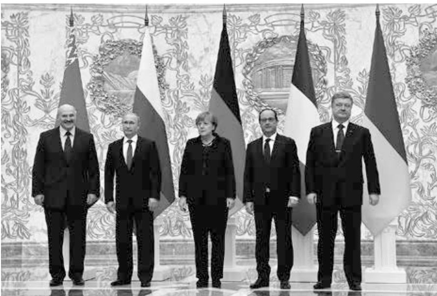
Gespräche im Normandie-Format in Minsk: Alexander Lukaschenko, Wladimir Putin, Angela Merkel, Francois Hollande und Petro Poroschenko nehmen an den Gesprächen über eine Lösung für die Situation in der Ukraine teil, 11.2.215.

Sacharowa: Ich werde sie Ihnen zusenden.