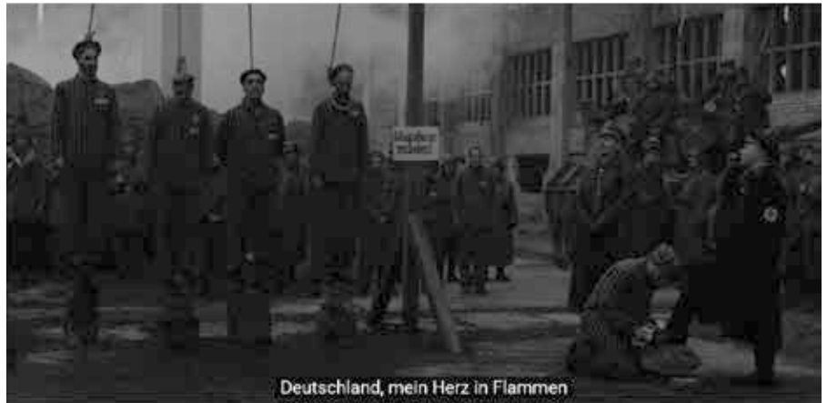
Bild 2: Screenshot aus dem Musikvideo der Gruppe Rammstein "Deutschland"