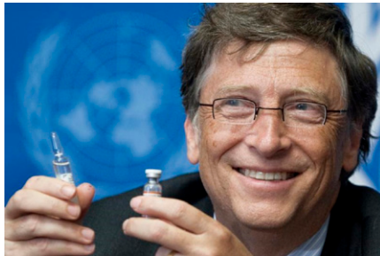
Bill Gates, Co-Vorsitzender der Bill & Melinda Gates Foundation, zeigt während der Pressekonferenz einen Impfstoff., 17.5.2011

kommt Ihnen dummerweise erst zu spät oder gar nicht in den Sinn.)