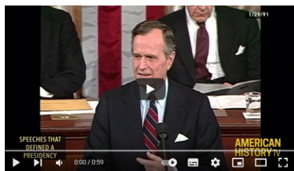
Speeches That Defined a Presidency: "A New World Order", 1991. (Screenshot: https://www.youtube.com/watch?v=7lRQHcbRbmU )

In der Essenz heißt das: Wir werden dem Gesundheitsdiktat einer Weltoberbehörde ausgesetzt sein, ohne uns dagegen auch nur in Ansätzen wehren zu können. Eine solche Situation nenne ich „Gesundheitsfaschismus“. Wer dafür einen besseren Begriff hat oder wer gute Gründe hat, das anders zu bewerten, lasse mir diese zukommen. Ich lerne immer gerne dazu.