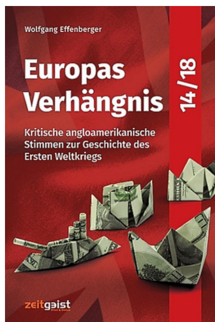
( https://www.weltbild.de/artikel/buch/europas-verhaengnis-14-18_25461381-1 )

In diesem Sinn fordert leider auch Miliband: „Harte Macht in Form von militärischen Partnerschaften und Handelskooperationen wird für die Beziehungen des Westens mit dem Rest der Welt entscheidend sein.“