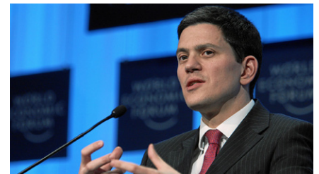
David Miliband, Staatssekretär für auswärtige und Commonwealth-Angelegenheiten des Vereinigten Königreichs, spricht während der Sitzung „Wiederaufbau von Frieden und Stabilität in Afghanistan“ im Kongresszentrum auf der Jahrestagung 2010 des Weltwirtschaftsforums in Davos, Schweiz, am 29. Januar 2010.

„International Crisis Group“: „Die meisten nichteuropäischen Länder, die für die Verurteilung der russischen Aggression im vergangenen März gestimmt haben, haben keine Sanktionen ergriffen. In der UNO das Richtige zu tun, kann ein Alibi dafür sein, in der realen Welt nicht viel gegen den Krieg zu unternehmen.“ [8]