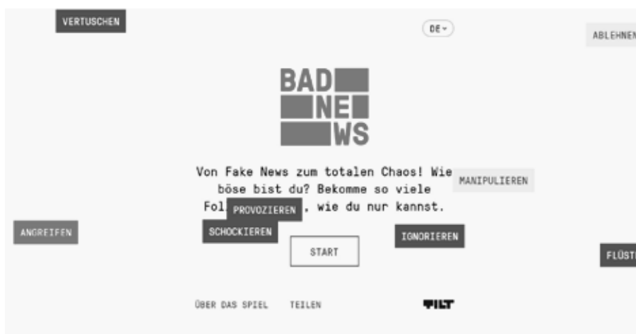
Screenshot des Online-Spiels "Get Bad News"