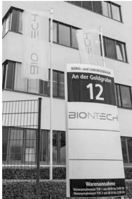
BioNtech-Informationsschild, Mainz, 13.11.2020.

ein ganzes Spektrum möglicher kritischer Aussagen über Impfstoffe. Wie die EU-Kommission, so wissen doch auch Lehrer und Schüler, dass hier Bezug auf die Corona-Pandemie und die Impfskepsis vieler Menschen genommen wird, und ordnen entsprechend ein.