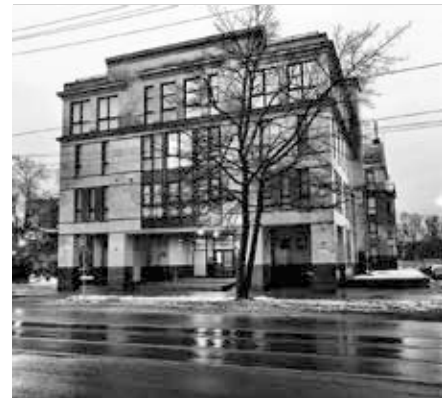
Das Gebäude der Internet Research Agency, auch „Russische Trollfabrik“ genannt, ist in der Savushkina-Straße in St. Petersburg, Russland, zu sehen. Das Gebäude ist ab sofort zu vermieten, 17.4.2018)

Die in den Spielen simulierte „Böswilligkeit“ existiert durchaus in der realen Welt. Wir alle kennen die von Gewinninteressen getriebenen Aufreger auf YouTube, Facebook oder Twitter. Auch trifft es zu, dass die Empörung über Regierungen oder Konzerne oftmals zum Selbstzweck gerät. Und ja, der Kreml fördert