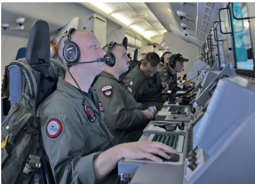
Crew einer P-8 Poseidon bei der Arbeit.

on leisteten. Was Norwegen eine gewisse Anerkennung verschaffen würde. Es ist dieselbe Logik wie in der Welt der Kriminellen, wenn der einfache Mann auf der Straße schmutzige Arbeit für den Mafia-boss erledigt. Auf diese Weise verschafft man sich Akzeptanz und erlangt höhere Positionen. Das ist zutiefst tragisch.