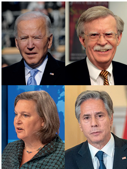
US-Präsident Joseph Biden (l.o.), Nationaler Sicherheitsberater unter Trump, John R. Bolton (r.o.), Assistant Secretary of State Victoria Nuland (l.u.) und US-Außenminister Antony Blinken (r.u.)

Wie wir alle wissen, haben sowohl US-Unterstaatssekretärin Victoria Nuland als auch Präsident Biden selbst im Januar/Februar 2022 versprochen, die Pipeline zu beseitigen, wenn Russland in die Ukraine einmarschiert [8]. Aber schon 2021 hatte der Ausschuss für auswärtige Beziehungen des Senats gesagt, dass sie die Pipeline „dauerhaft“ zu einem Ende bringen wollten [9]. Präsident Trumps nationaler