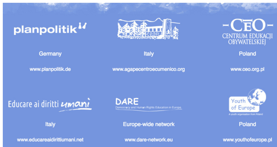
Bild 3: Partner von TEVIP (Translating European Values into Practice)

Fund, den Grünen und der Amadeu Antonio Stiftung.