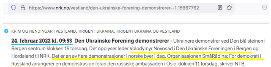
Bild 1: Wie im News-Ticker von NRK erschienen; die hervorgehobenen zwei Sätze bedeuten übersetzt: „Dies ist einer der vielen Proteste, die heute in norwegischen Städten stattfinden. Die Organisation ‚SmåRådina: Für Demokratie in Russland‘ organisiert am Donnerstag um 11 Uhr einen Protest vor der russischen Botschaft in Oslo.“

Beachten Sie außerdem, dass sage und schreibe 81,4% aller konfliktbedingten zi-