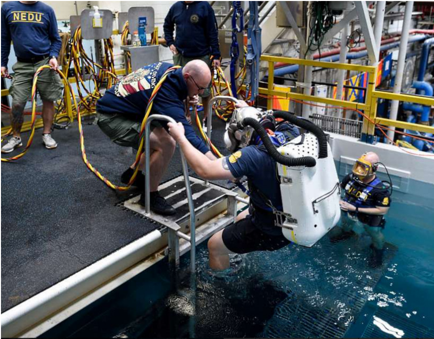
Ein Marinetaucher mit dem vom Office of Naval Research TechSolutions gesponserten MK29 Mixed Gas Rebreather System betritt den Pool der Naval Experimental Diving Unit im Naval Surface Warfare Center, Panama City Division, 4.4.2018.