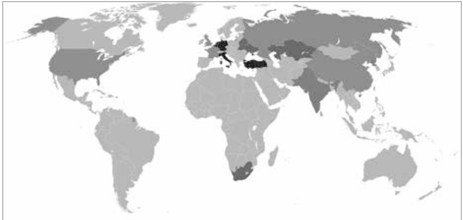
Hellblau: Atommächte im Atomwaffensperrvertrag (China, Frankreich, Russland, UK, USA), Rot: Atommächte ausserhalb des Atomwaffensperrvertrags (Indien, Nordkorea, Pakistan), Dunkelblau: Mitgliedsstaaten der Nuklearen Teilhabe, Grün: Ehemalige Atommächte

HK: In erster Linie, um das Risiko einer nuklearen Eskalation zu relativieren. Als