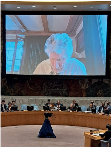
Roger Waters hält seine Rede vor dem UN-Sicherheitsrat am 08.02.2023.

Heute befassen wir uns mit der Möglichkeit des Friedens in der Ukraine, insbesondere mit der Bewaffnung des Kiewer Regimes durch Dritte.