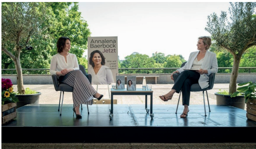
Annalena Baerbock stellt ihr Buch „Jetzt. Wie wir unser Land erneuern“ vor, bei dem sie fleissig plagiierte.