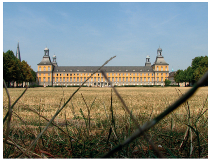
Die Rheinische Friedrich Wilhelms-Universität Bonn berief Ulrike Guérot auf die Professur für Europapolitik.

Guérot hat einen ganz anderen 'Fehler' begangen. Lange war sie der Liebling