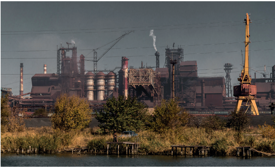
Azovstal, 6.10.2014

Aufgrund ihrer strategischen Lage am Asowschen Meer – nur eine kurze Fährfahrt von den reichsten Eisenminen der UdSSR entfernt – erlebte die Region in den folgenden Jahrzehnten eine explosionsartige wirtschaftliche Entwicklung. Am bemerkenswertesten war das heute berühmte Stahlwerk Azovstal, ein Kronjuwel aus Stalins erstem Fünfjahresplan. Der Grundstein für das Werk wurde 1930 gelegt und bereits 1933 produzierte Azovstal seinen ersten Gussblock. Die Produktion stieg rasch an, und 1939 stellte das Werk einen Weltrekord auf, indem es an einem einzigen Tag 1.614 Tonnen Roheisen produzierte.