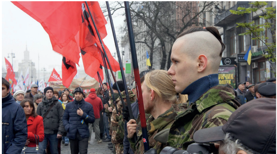
UNA-UNSO-Mitglieder auf dem Europaplatz in Kiew, 24.11. 2013.

Am berühmtesten war das Asowsche Bataillon. Lange vor seiner zynischen Umbenennung im Zuge der russischen Invasion 2022 war das Asowsche Bataillon 2014 eine offen neonazistische Miliz. Die