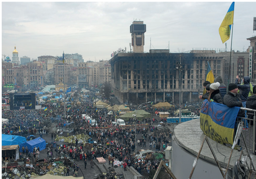
Maidan von oben, 24.2.2014

Die Lösung dieses Widerspruchs ist einfach. Wenn man den Menschen im Donbass ihre Identität und Geschichte als Ukrainer nimmt, wird es viel einfa-