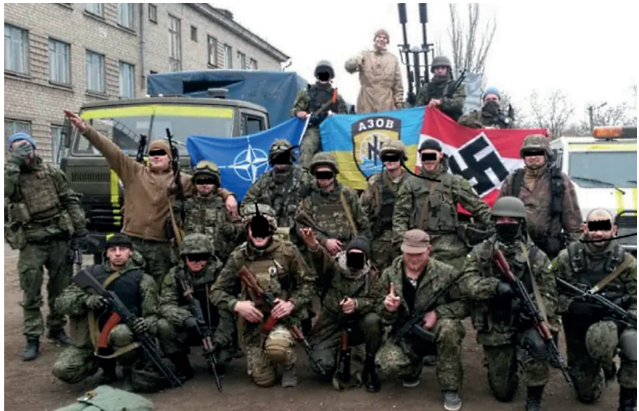
Azov-Soldaten mit Nazi-Flagge, 13.9.2018.