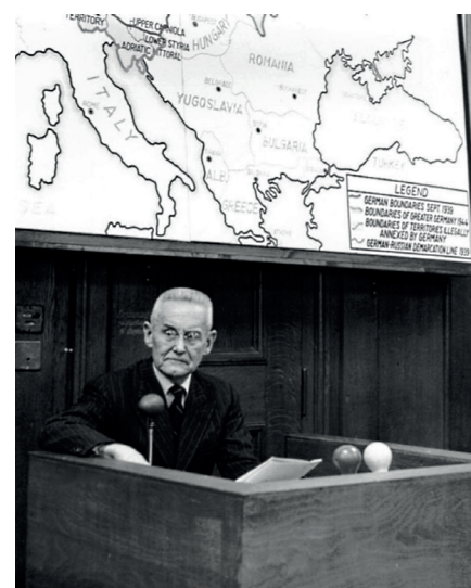
Franz Halder als Zeuge der Anklage beim Nürnberger Prozess gegen das OKW, 1945/46

Die Alliierten hielten Halders Befehle für so abstoßend, dass Nazis wie Hermann Hoth [9] und Wilhelm von Leeb [10] wegen Verbrechen gegen die Menschlichkeit verurteilt wurden, nur weil sie diese an ihre Untergebenen weitergegeben hatten. Viele rangniedere Nazis wurden gehängt, weil sie Halders Befehle in der Sowjetunion befolgt hatten. Trotzdem hatte Halder keinerlei Konsequenzen für die Erteilung dieser Befehle zu tragen.