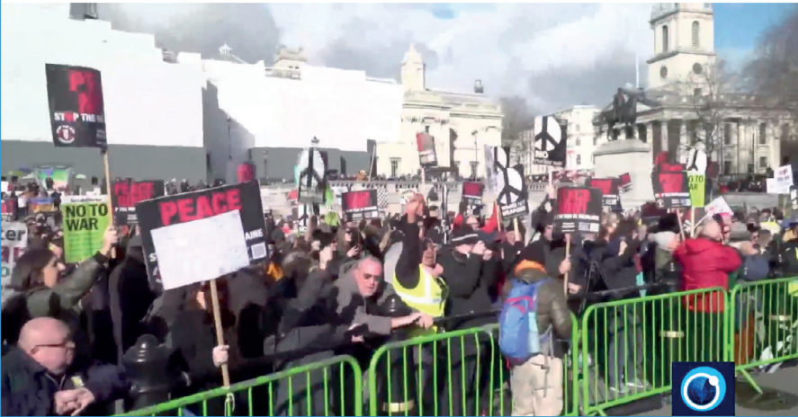
No-NATO-Demo in London am 25.2.2023

Sunday, 26 February 2023 12:34 AM [ Last Update: Sunday, 26 February 2023 12:39 AM ]