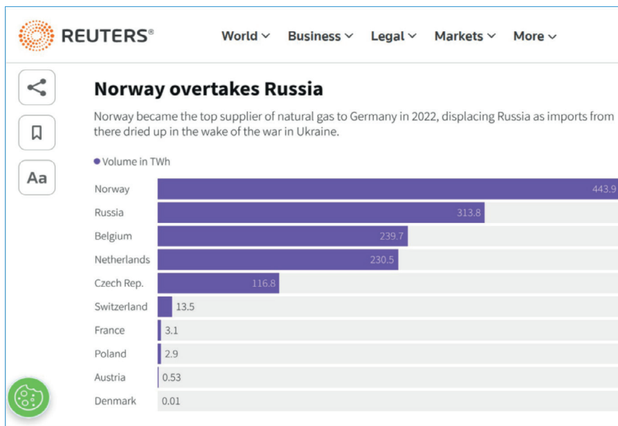
Norwegen wird Gaslieferant für Deutschland (Reuters)

Um auf Hershs Bericht zurückzukommen: Besonders interessant sind die Entscheidungen, die getroffen wurden, um eine Klassifizierung der Operation, die eine Berichterstattung an den Kongress erfordern würde, auf verschiedene Weise zu vermeiden. Im Hinblick auf die Geschichte der Vereinigten Staaten sollte dies ein großes Problem sein.