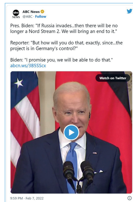
Biden kündigt das Ende von Nordstream bereits im Februar 2022 an.

Er antwortete, indem er sich auf das Videospiel „Championship Manager“ (inzwischen in „Football Manager“ umbenannt) bezog, das wir früher zusammen gespielt haben. Er sagte, als er das Spiel spielte, sei es immersiv gewesen. Er war Manager von Liverpool, und es habe ihn völlig absorbiert. („Immersiv“