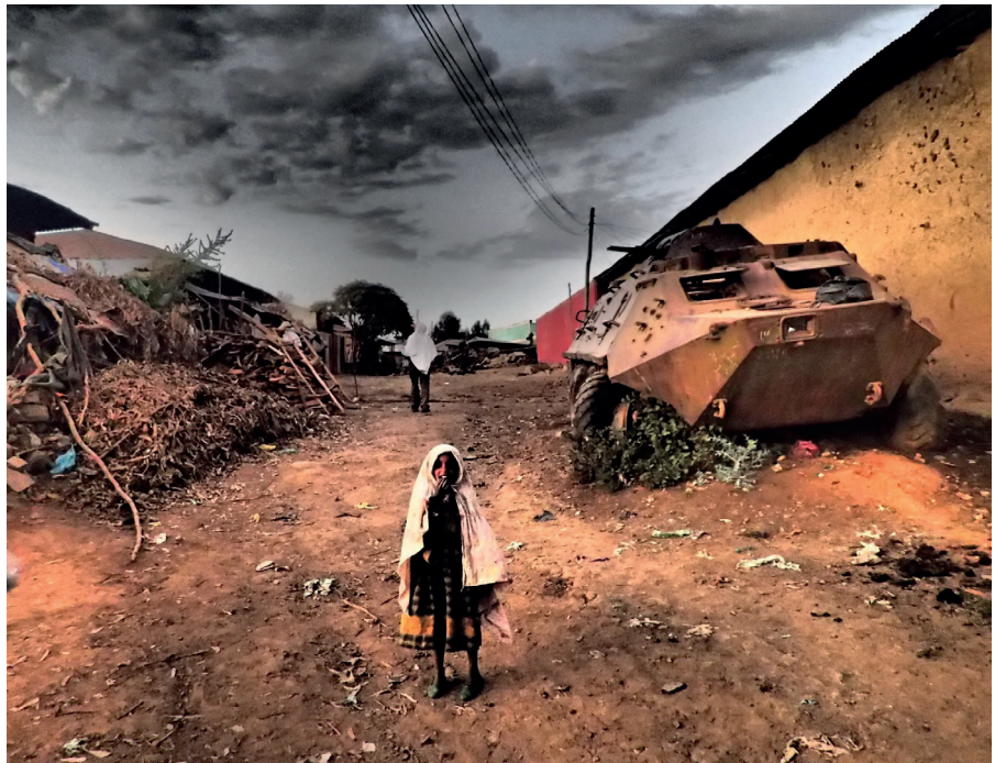
Überreste aus dem äthiopischen Bürgerkrieg, 19.2.2015.