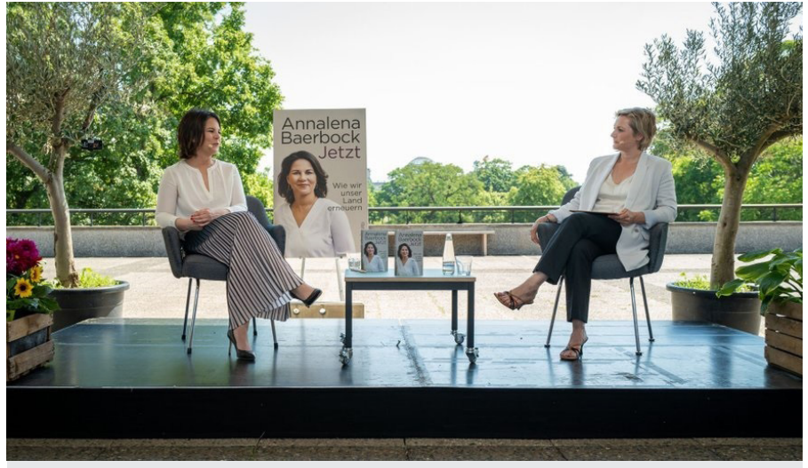
Annalena Baerbock stellt ihr Buch „Jetzt. Wie wir unser Land erneuern“ vor, bei dem sie fleissig plagiierte.