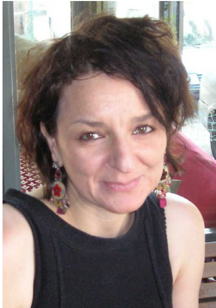
Die französisch-israelische Soziologin von der Hebräischen Universität Jerusalem wünscht sich am Jahrestag der Sportpalastrede von Goebbels den „totalen Sieg“ der Ukraine.