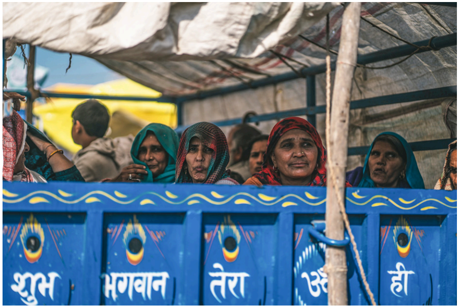
Die Massenunterkünfte für die Arbeiterinnen sind z.T. weit entfernt von den Fabriken. Die Kosten für die Fahrten werden vom ohnehin sehr geringen Lohn abgezogen.

Diese Arbeitsbedingungen sind extrem menschenrechtswidrig. Die Gewerkschaften von Tamil Nadu fordern „ein Ende dieser Zwangsarbeit und Ausbeutung“.