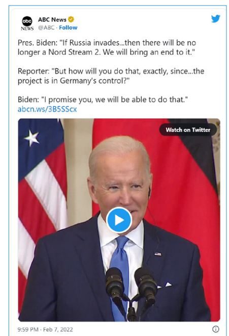
Biden kündigt das Ende von Nordstream bereits im Februar 2022 an.

Er antwortete, indem er sich auf das Videospiel „Championship Manager“ (inzwischen in „Football Manager“ umbenannt) bezog, das wir früher zusammen gespielt haben. Er sagte, als er das Spiel spielte, sei es immersiv gewesen. Er war Manager von Liverpool, und es habe ihn völlig absorbiert. („Immersiv“