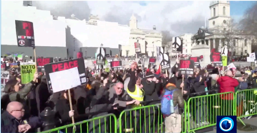
No-NATO-Demo in London am 25.2.2023

Sunday, 26 February 2023 12:34 AM [ Last Update: Sunday, 26 February 2023 12:39 AM ]