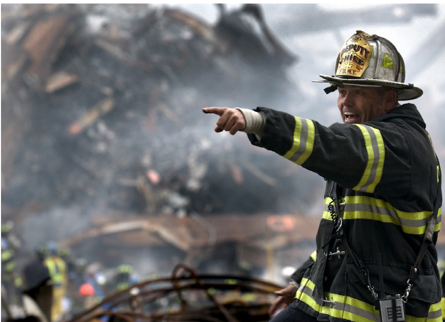
Feuerwehrmann im Einsatz, New York, 11.9.2001.