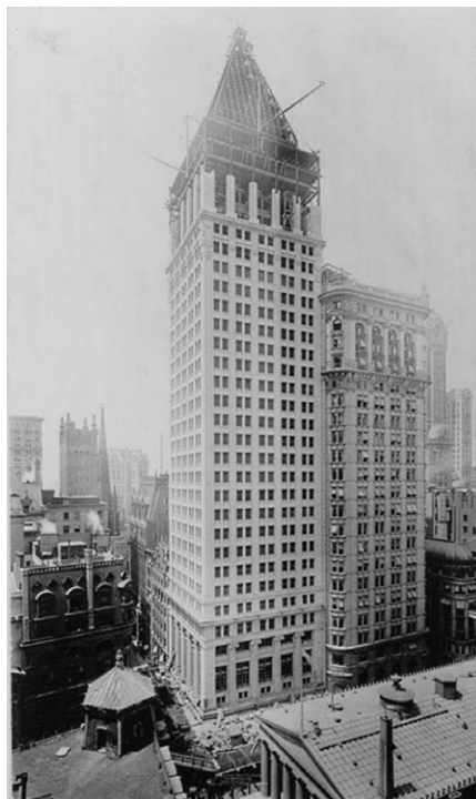
Gebäude der Bankers Trust Co. im Bau, New York, 20.6.1911.