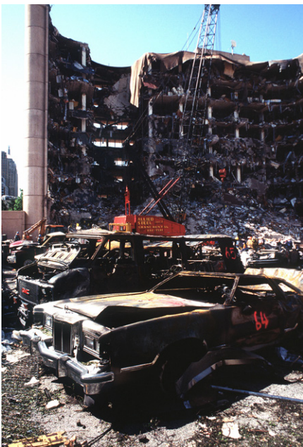
Die zerbombten Überreste von Autos mit dem zerbombten Bundesgebäude im Hintergrund. Das Militär leistet rund um die Uhr Unterstützung, seit am Mittwoch, dem 19. April 1995, eine Autobombe im Inneren des Gebäudes explodierte, 21.4.1995.

Der Stand der Ermittlungen zum 11. September 2001 ist nach demselben Muster verlaufen. Die Notwendigkeit, Informationen der Geheimhaltung einzuordnen oder anderweitig zu verbergen, zielt eindeutig darauf ab, von der Regierung sanktionierte Verbindungen zu diesen Verbrechen zu verschleiern und hochrangige Personen und Organisationen – innerhalb oder außerhalb der Regierung