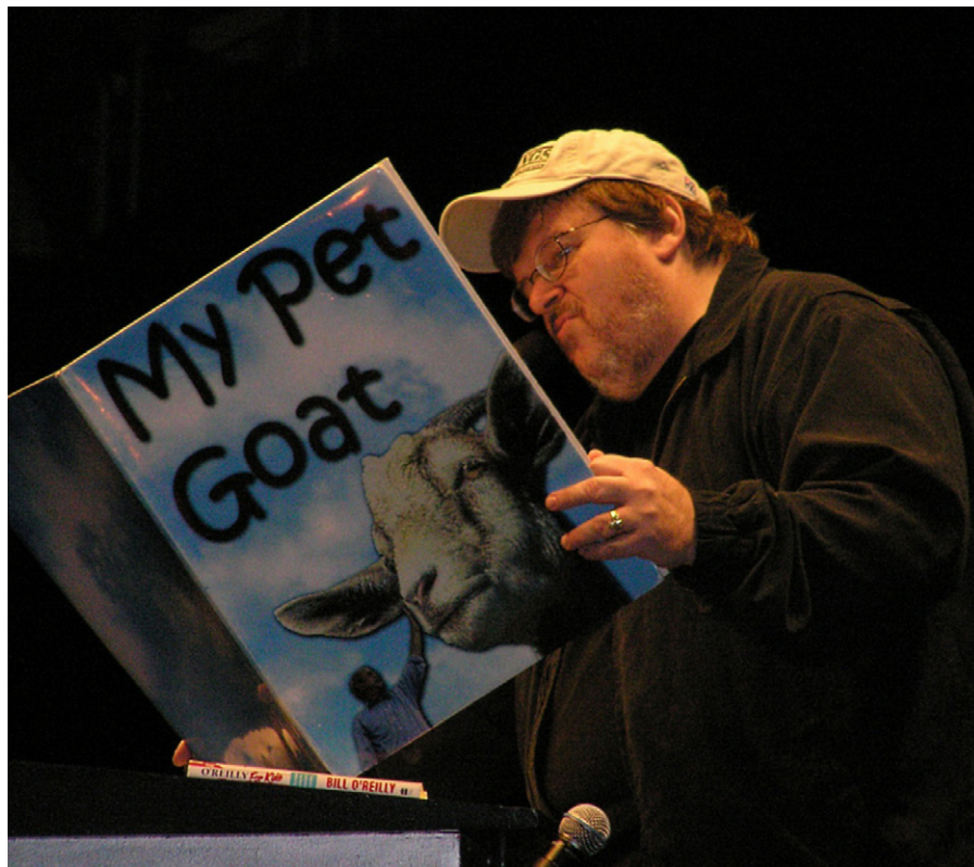
Michael Moore parodiert George Bush 9/11, 20.1.2004.