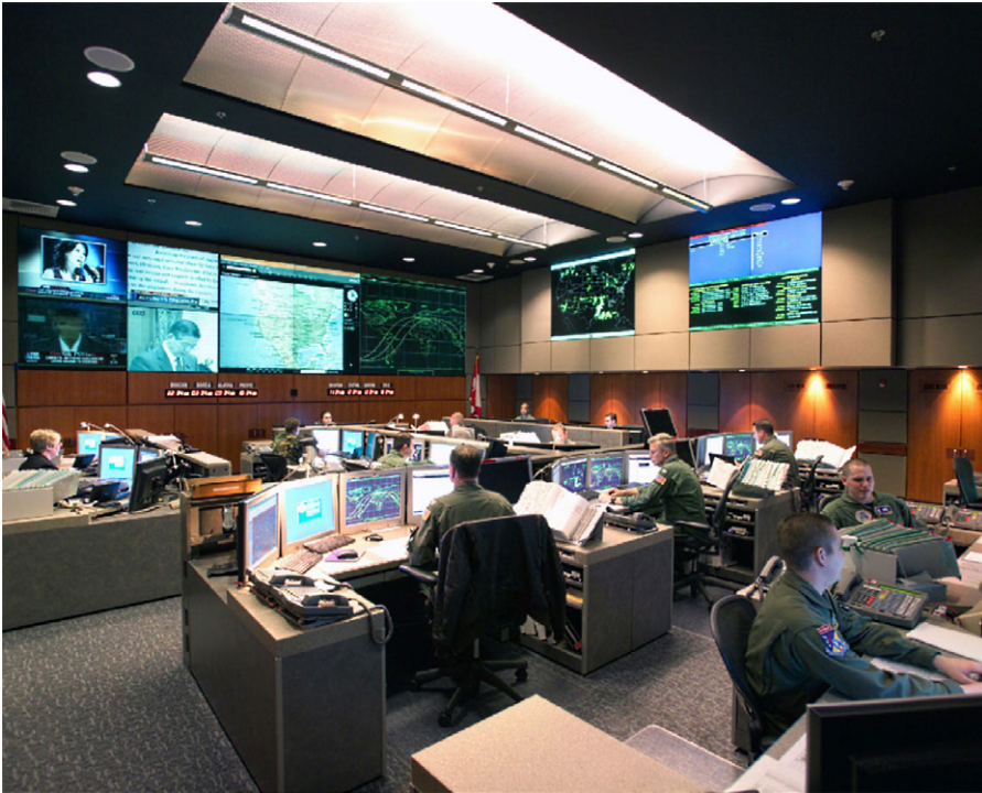
NORAD-Kommandozentrum, Cheyenne Mountain, Colorado, USA, circa 2005.

Think-Tanks der USA, Anm. d. Redaktion). [8] Er trug in diesen Funktionen maßgeblich zu einem Strategiepapier bei, in dem ein Präventivkrieg befürwortet wurde – dieses bildete dann die intellektuelle Grundlage für die Invasion des Irak im Jahr 2003. [9]