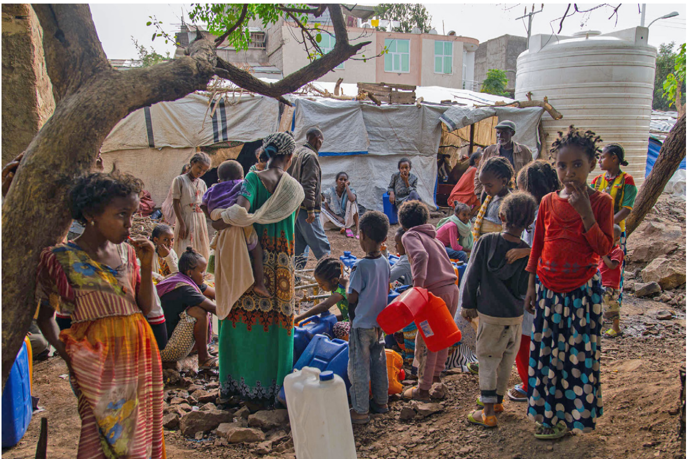
Flüchtlinge in Shire, 11. Juni 2021

Der TPLF-Delegierte Wondimu Asaminew räumte ein, dass es bei dem Tref-