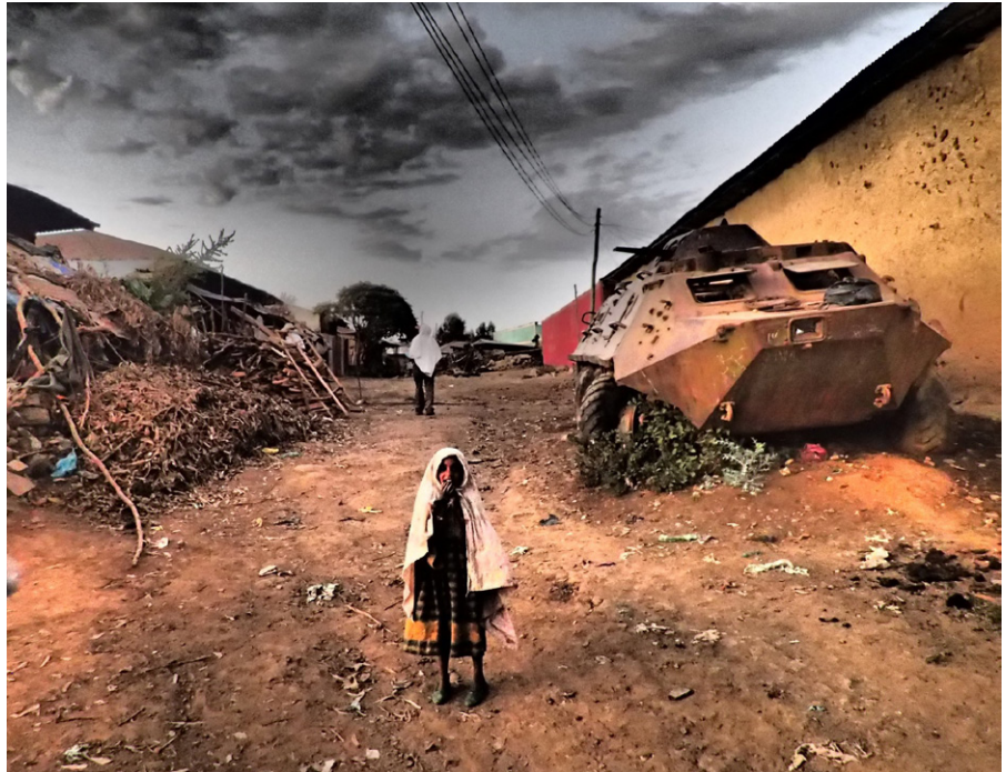
Überreste aus dem äthiopischen Bürgerkrieg, 19.2.2015.