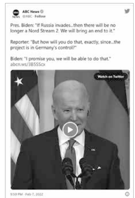
Biden kündigt das Ende von Nordstream bereits im Februar 2022 an.

Er antwortete, indem er sich auf das Videospiel „Championship Manager“ (inzwischen in „Football Manager“ umbenannt) bezog, das wir früher zusammen gespielt haben. Er sagte, als er das Spiel spielte, sei es immersiv gewesen. Er war Manager von Liverpool, und es habe ihn völlig absorbiert. („Immersiv“