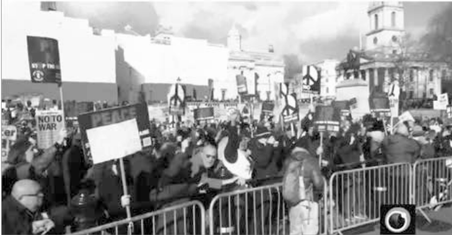
No-NATO-Demo in London am 25.2.2023

Sunday, 26 February 2023 12:34 AM | Last Update: Sunday, 26 February 2023 12:39 AM |