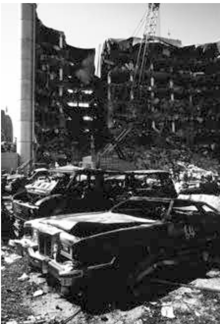
Die zerbombten Überreste von Autos mit dem zerbombten Bundesgebäude im Hintergrund. Das Militär leistet rund um die Uhr Unterstützung, seit am Mittwoch, dem 19. April 1995, eine Autobombe im Inneren des Gebäudes explodierte, 21.4.1995.

Der Stand der Ermittlungen zum 11. September 2001 ist nach demselben Muster verlaufen. Die Notwendigkeit, Informationen der Geheimhaltung einzuordnen oder anderweitig zu verbergen, zielt eindeutig darauf ab, von der Regierung sanktionierte Verbindungen zu diesen Verbrechen zu verschleiern und hochrangige Personen und Organisationen – innerhalb oder außerhalb der Regierung