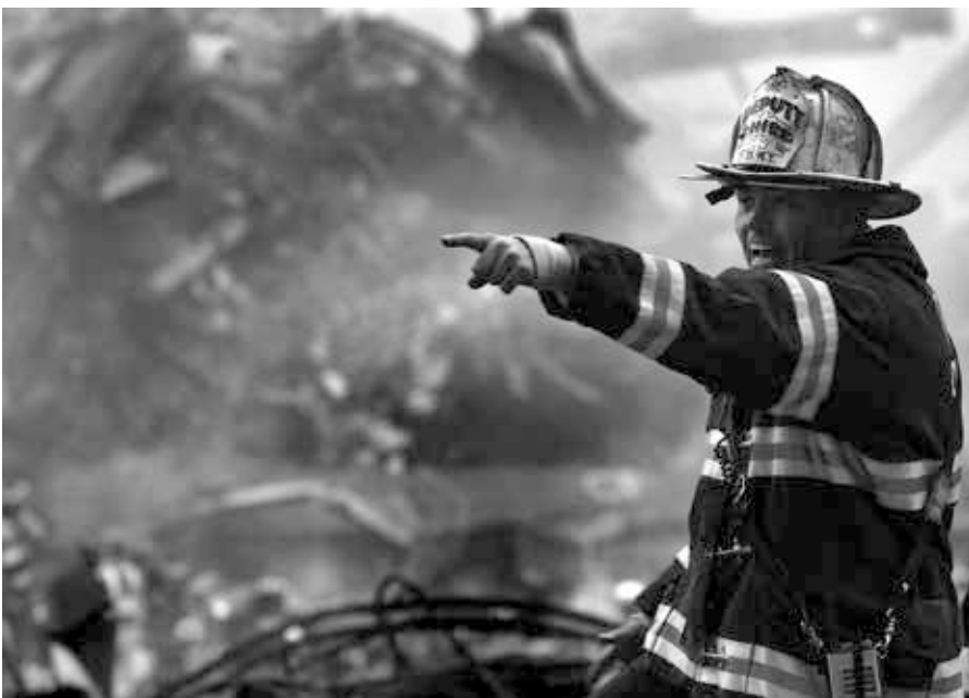
Feuerwehrmann im Einsatz, New York, 11.9.2001.