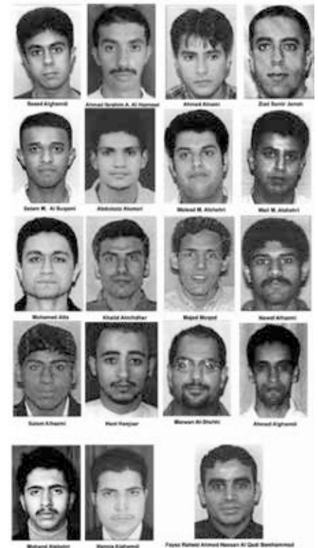
Liste der mutmaßlichen Terroristen, die das US-Verteidigungsministerium sechs Tage nach den Anschlägen am 11.9.2001 auf das World Trade Center in New York bekannt gab.

Lee Hamilton war bezeichnenderweise ein überzeugter Anhänger des „Exe-