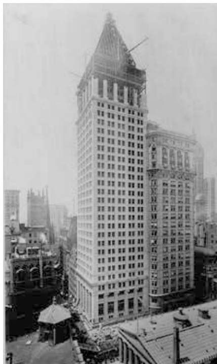
Gebäude der Bankers Trust Co. im Bau, New York, 20.6.1911.