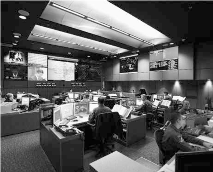
NORAD-Kommandozentrum, Cheyenne Mountain, Colorado, USA, circa 2005.

Think-Tanks der USA, Anm. d. Redaktion). [8] Er trug in diesen Funktionen maßgeblich zu einem Strategiepapier bei, in dem ein Präventivkrieg befürwortet wurde – dieses bildete dann die intellektuelle Grundlage für die Invasion des Irak im Jahr 2003. [9]