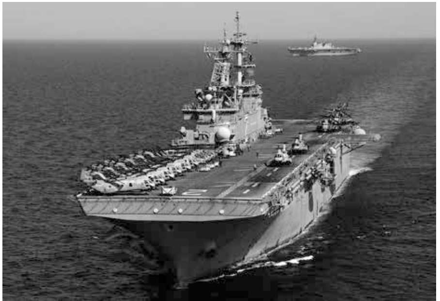
Die USS Essex (LHD 2) kreuzt vor der Küste Nordostjapans mit JS Hyuga (DDH 181).

[5] CSIS, Mark F. Cancian, „The First Battle of the Next War: Wargaming a Chinese Invasion of Taiwan“, am 9.1.2023, < https://www.csis.org/analysis/first-battle-next-war-wargaming-chinese-invasion-taiwan >