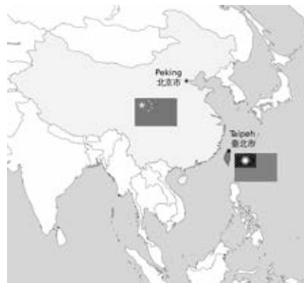
China sieht Taiwan als Teil der Volksrepublik. Die „Ein-China-Politik“ wird international anerkannt.

Das doppelte Spiel Washingtons, einerseits die chinesische Souveränität über Taiwan offiziell anzuerkennen und andererseits diese Souveränität offen und vorsätzlich mit Füßen zu treten, wird am besten durch den Besuch Nancy Pelosi in einem offiziellen Flugzeug der US-Luft-