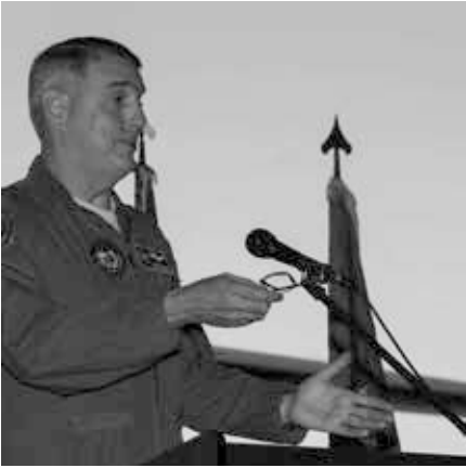
Maj. Gen. Michael A. Minihan, U.S. Indo-Pacific Command / (Public Domain)

Auf der aktuellen Website des US-Außenministeriums zu den „U.S. Relations With Taiwan“ wird offiziell festgestellt, dass „wir die Unabhängigkeit Taiwans nicht unterstützen“ [2].