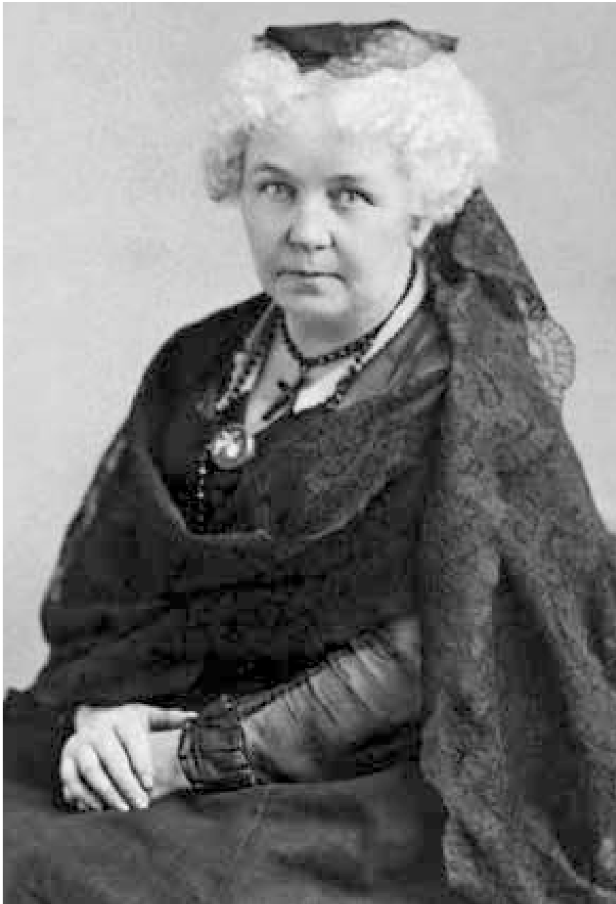
Elizabeth Cady Stanton (1815-1902) um 1880. Sie war eine führende Figur der frühen US-amerikanischen Frauenrechtsbewegung. 1891 sprach sie vor dem Rat der Frauen und erwähnte in ihrer Rede neben anderen indigenen Gesellschaften explizit auch die Haudenosaunee.

derholtem Fehlverhalten des Rates oder Langhauses verwiesen.