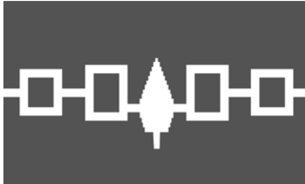
Flagge der der Haudenosaunee-Konföderation. Von rechts nach links sind symbolisch die Gebiete der Mohawk, Oneida, Onondaga, Cayuga und Seneca gezeigt. (Bild: Himasaram, Zscout370, Wikimedia.org, Public Domain)

In dieser düsteren Epoche erscheint ein Mann auf der Bildfläche, der innerhalb von 40 Jahren alle verfeindeten Stämme besucht und ihre Führungspersonlichkeiten dazu bringt, sich gemeinsam zu versammeln. Der „Friedensstifter“ überbringt allen 50 „Chiefs“ seine Botschaft des Friedens und der Einigkeit. Er schafft das, was unmöglich erschien: Er vereint die fünf bis aufs Blut verfeindeten Nati-