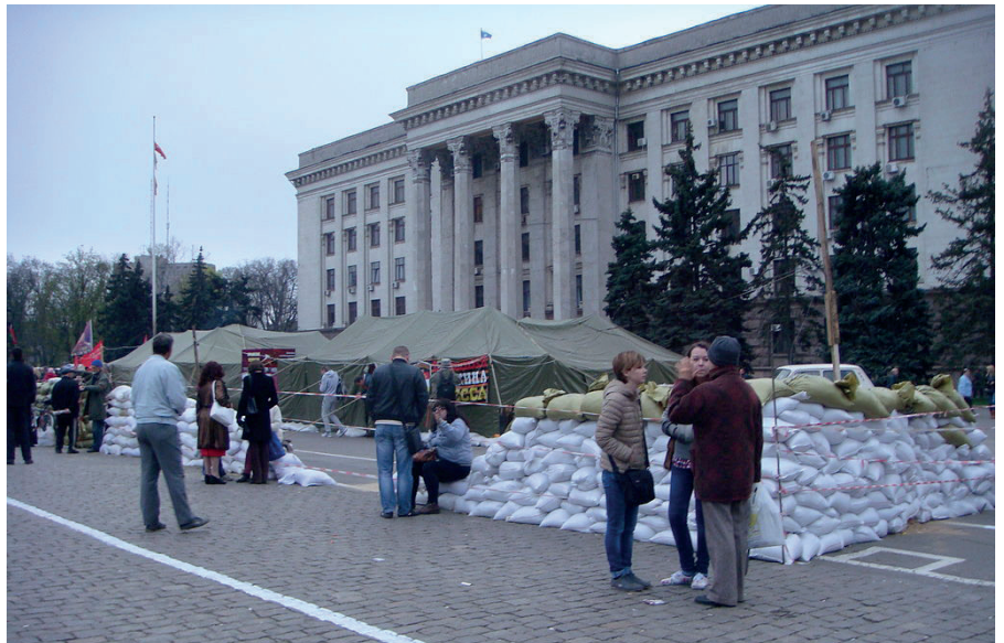
Das Protestcamp der Anti-Maidan-Aktivisten auf dem Kulikow-Platz vor dem Gewerkschaftsgebäude in Odessa. April 2014. In dem Gewerkschaftsgebäude wurde von Maidan-Aktivisten, Mitgliedern des Rechten Sektors und Hooligans ein Massaker verübt.

Interessant in diesem Zusammenhang ist allerdings noch, was in Wikipedia über den erwähnten Wiktor Pschonka zu erfahren ist, dessen Ermittlungen die oben