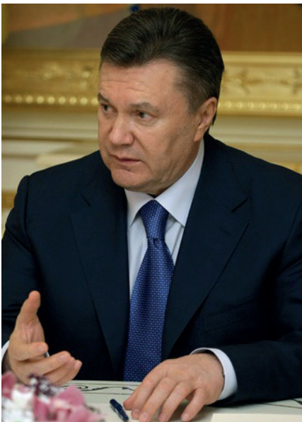
Wiktory Janukowytsch, ukrainischer Präsident 2010-2014