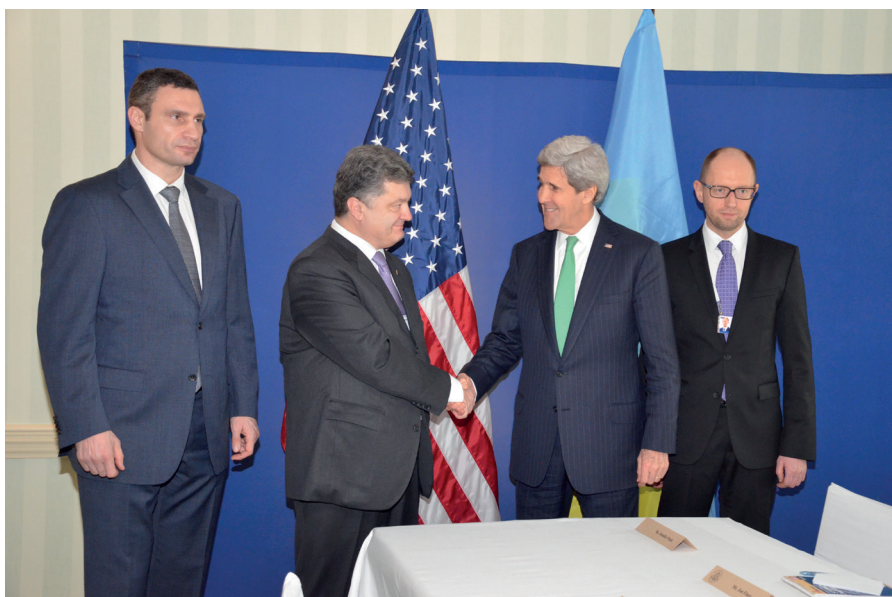
Münchner Sicherheitskonferenz 2014 – Petro Poroschenko und US-Außenminister John Kerry beim Händeschütteln; links Vitali Klitschko, rechts Arsenij Jazenjuk

02.02.14: US-Außenminister John Kerry stellt bereits auf der Münchner Sicherheitskonferenz die ukrainische Opposition vor: Poroschenko, Jazenjuk und Klitschko.