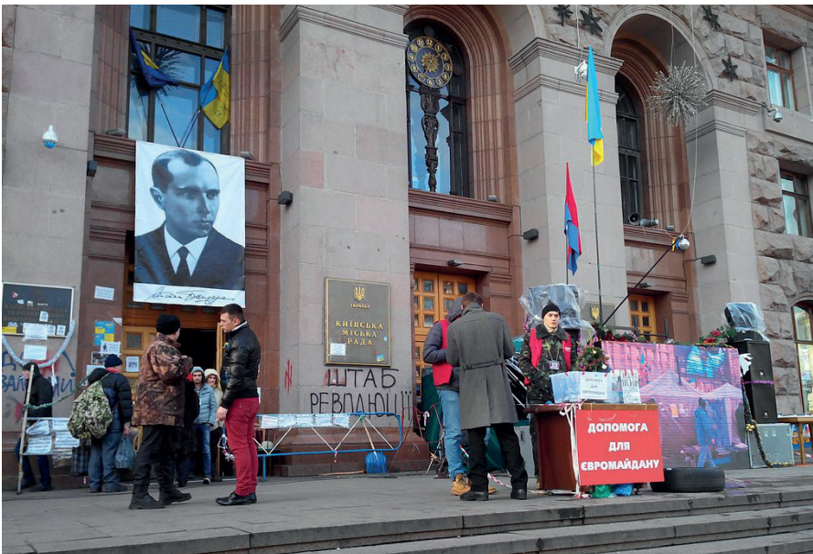
Stepan-Bandera-Porträt am Rathaus Kiew, 14. Januar 2014.

lich verwerfliche Erklärungen oder Aktionen erfolgt. Was sich nach Sichtung der vier hier genannten Dokumentarfilme sowie zahlreicher weiterer – sowohl alternativer als auch allerdings bereits älterer leitmedialer – Quellen jedoch klar abzeichnet: Ich konnte keinerlei Tatbestände ermitteln, die ein auch nur im Ansatz vergleichbares Maß an Unrecht begründen, das von Bewohnern dieser Gebiete verursacht worden wäre. Ferner fanden vonseiten des Anti-Maidan-Lagers bzw. der Gegner des Assoziierungsabkommens mit der EU, zumindest bis zum 24.02.22, niemals Angriffe auf prowestliche Gebiete oder die entsprechende Zivilbevölkerung statt, die durch unabhängige Quellen dokumentiert wären, mit der möglichen Ausnahme einzelner Gegenmaßnahmen bzw. Notwehrreaktionen, die als Reaktion auf (para-) militärische Angriffe durch prowestliche Verbände auf „Separatistengebiete“ erfolgten.