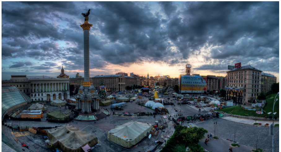
Maidan im Sommer 2014. Auf dem Platz kam es zu Zusammenstößen zwischen Demonstranten und Polizeieinheiten. Scharfschützen schossen sowohl auf Demonstranten als auch auf Polizisten.

Jacques Baud, ein ehemaliger Geheimdienststoffizier der Schweizer Armee, strategischer Analyst und Buchautor mit den Schwerpunkten Geheimdienst und Terrorismus, der in seiner Laufbahn einige internationale Positionen bekleidete, „darunter auch bei der NATO, wo er den Fluss von Kleinwaffen im Donbass überwachte und an einem NATO-Programm zur Unterstützung der ukrainischen Streitkräfte bei der Wiederherstellung ihrer Kapazitäten und der Verbesserung der Personalverwaltung beteiligt war“, drückt dies moderater aus, was jedoch am Phänomen der Realitätsverweigerung via Projektion nichts ändert: „Im Jahr 2014, während der Maidan-Revolution in Kiew, war ich bei der NATO in Brüssel. Mir ist aufgefallen, dass die Menschen die Situation nicht so einschätzen, wie sie ist, sondern wie sie sie sich wün-