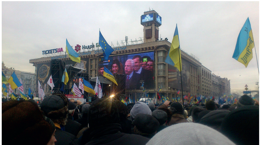
John McCain solidarisiert sich während seines Besuchs des prowestlichen Oppositionslagers auf dem Maidan öffentlich mit dem Rechtsextremen Oleh Tjahnybok und spricht auf der Bühne.

Seit 2014 verstärkt die NATO ihre Manöver-Aktivitäten in Europa (ca. 300 pro Jahr, z.B. „Defender 2020“). Deutschland