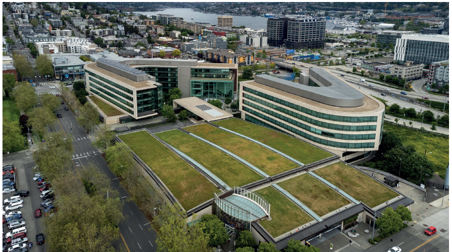
Das Gebäude der Bill & Melinda Gates Foundation, 28.5.2022

VIB ist Peter Piot [33], ein weiterer enger Mitarbeiter von Bill Gates und ehemaliger Covid-Sonderberater von Ursula von der Leyen [34].