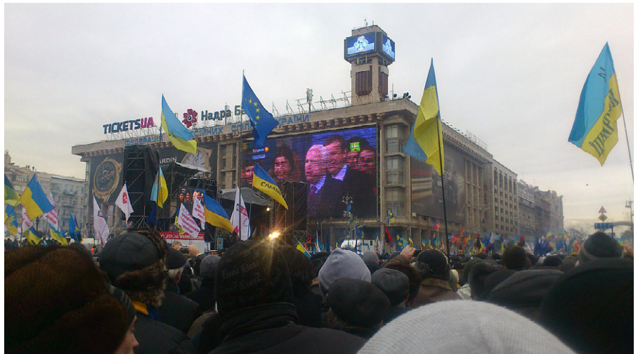
John McCain solidarisiert sich während seines Besuchs des prowestlichen Oppositionslagers auf dem Maidan öffentlich mit dem Rechtsextremen Oleh Tjahnybok und spricht auf der Bühne.

Seit 2014 verstärkt die NATO ihre Manöver-Aktivitäten in Europa (ca. 300 pro Jahr, z.B. „Defender 2020“). Deutschland