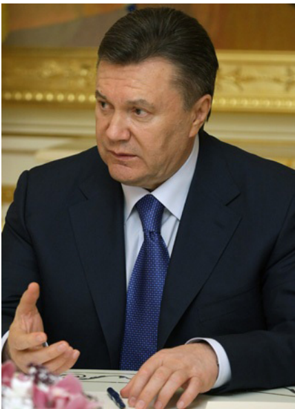
Wiktory Janukowytsch, ukrainischer Präsident 2010-2014