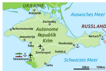
Karte der Krim-Republik (2014). Public domain.

26.02.14: Anti-Maidan-Anhänger, darunter viele Jugendliche, errichten auf dem Kulikow-Feld vor dem Gewerkschaftshaus, Odessa, ein Protestcamp gegen die