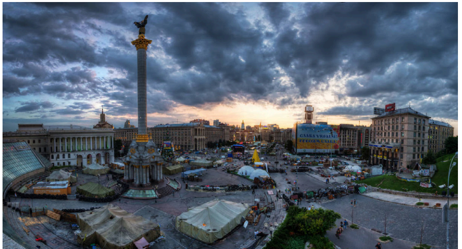
Maidan im Sommer 2014. Auf dem Platz kam es zu Zusammenstößen zwischen Demonstranten und Polizeieinheiten. Scharfschützen schossen sowohl auf Demonstranten als auch auf Polizisten.

Jacques Baud, ein ehemaliger Geheimdienststoffizier der Schweizer Armee, strategischer Analyst und Buchautor mit den Schwerpunkten Geheimdienst und Terrorismus, der in seiner Laufbahn einige internationale Positionen bekleidete, „darunter auch bei der NATO, wo er den Fluss von Kleinwaffen im Donbass überwachte und an einem NATO-Programm zur Unterstützung der ukrainischen Streitkräfte bei der Wiederherstellung ihrer Kapazitäten und der Verbesserung der Personalverwaltung beteiligt war“, drückt dies moderater aus, was jedoch am Phänomen der Realitätsverweigerung via Projektion nichts ändert: „Im Jahr 2014, während der Maidan-Revolution in Kiew, war ich bei der NATO in Brüssel. Mir ist aufgefallen, dass die Menschen die Situation nicht so einschätzen, wie sie ist, sondern wie sie sie sich wün-