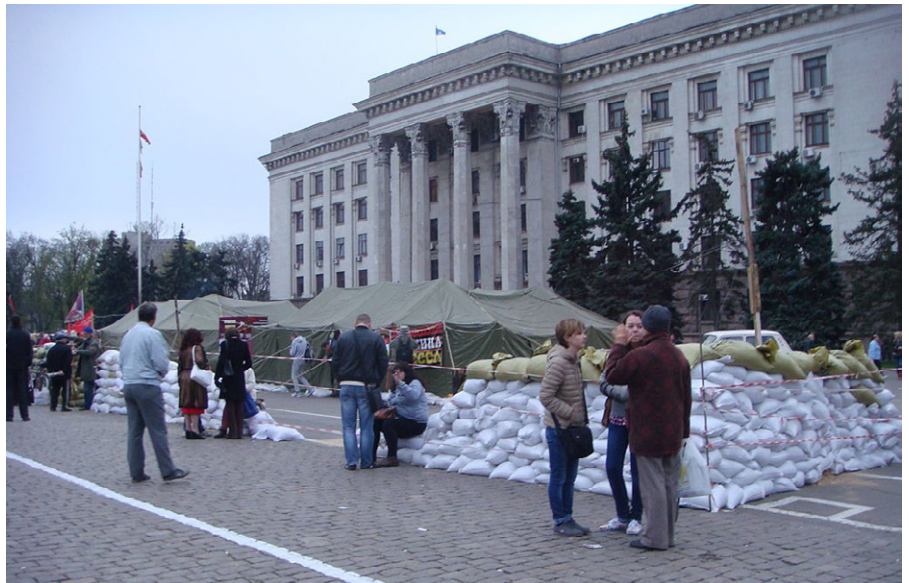
Das Protestcamp der Anti-Maidan-Aktivisten auf dem Kulikow-Platz vor dem Gewerkschaftsgebäude in Odessa. April 2014. In dem Gewerkschaftsgebäude wurde von Maidan-Aktivisten, Mitgliedern des Rechten Sektors und Hooligans ein Massaker verübt.

Interessant in diesem Zusammenhang ist allerdings noch, was in Wikipedia über den erwähnten Wiktor Pschonka zu erfahren ist, dessen Ermittlungen die oben