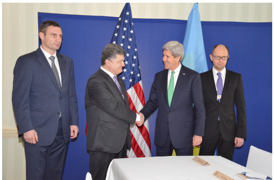
Münchner Sicherheitskonferenz 2014 – Petro Poroschenko und US-Außenminister John Kerry beim Händeschütteln; links Vitali Klitschko, rechts Arsenij Jazenjuk

02.02.14: US-Außenminister John Kerry stellt bereits auf der Münchner Sicherheitskonferenz die ukrainische Opposition vor: Poroschenko, Jazenjuk und Klitschko.