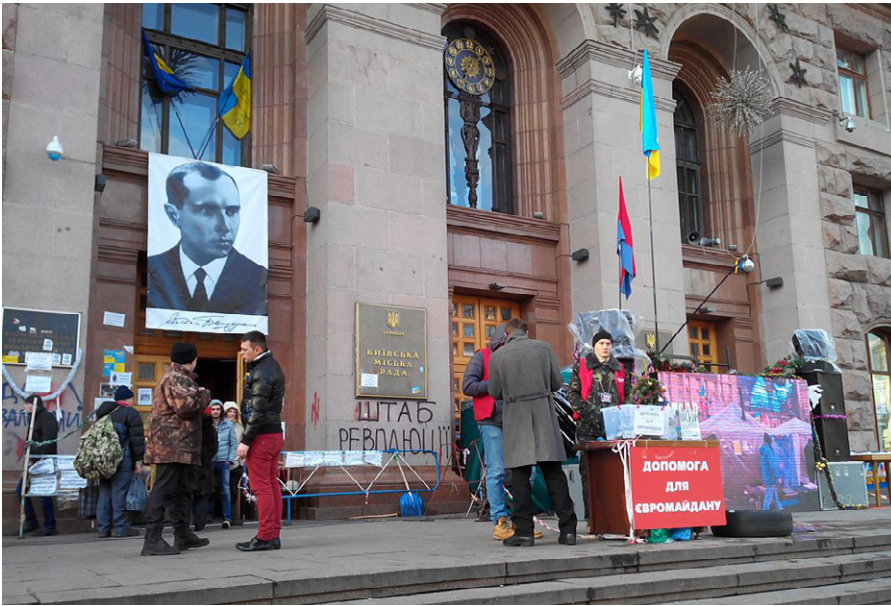
Stepan-Bandera-Porträt am Rathaus Kiew, 14. Januar 2014.

lich verwerfliche Erklärungen oder Aktionen erfolgt. Was sich nach Sichtung der vier hier genannten Dokumentarfilme sowie zahlreicher weiterer – sowohl alternativer als auch allerdings bereits älterer leitmedialer – Quellen jedoch klar abzeichnet: Ich konnte keinerlei Tatbestände ermitteln, die ein auch nur im Ansatz vergleichbares Maß an Unrecht begründen, das von Bewohnern dieser Gebiete verursacht worden wäre. Ferner fanden vonseiten des Anti-Maidan-Lagers bzw. der Gegner des Assoziierungsabkommens mit der EU, zumindest bis zum 24.02.22, niemals Angriffe auf prowestliche Gebiete oder die entsprechende Zivilbevölkerung statt, die durch unabhängige Quellen dokumentiert wären, mit der möglichen Ausnahme einzelner Gegenmaßnahmen bzw. Notwehrreaktionen, die als Reaktion auf (para-) militärische Angriffe durch prowestliche Verbände auf „Separatistengebiete“ erfolgten.