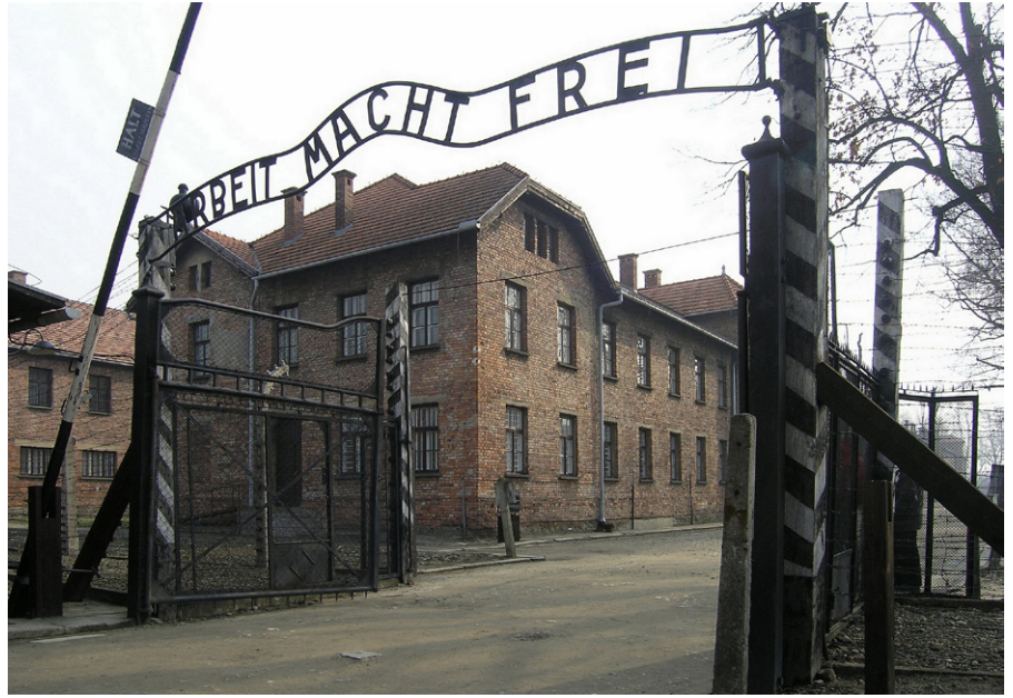
Haupt-Eingangstor des KZ Auschwitz, 10.3.2007

Einer davon wurde nun 77 Jahre danach als einstiger Wachmann des KZ Sachsenhausen, als „willfähriger Helfer der Täter“, zu fünf Jahren Haft verurteilt. Ein 101 Jahre alter Mann. Günther und Herbert Quandt waren aber keine willfährigen Helfer, sondern aktive Täter. Er und seine Familie blieben nach 1945 straffrei. Ihr heutiges Vermögen beruht