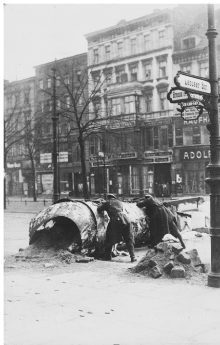
Große Frankfurter Straße Ecke Leuser Straße Barrikade Kampf während der Novemberrevolution in Berlin 02 Bildseite Schaulustige, Januar 1919.

Waffen und die Munition für furchterliche Kriege kamen in zwei Weltkriegen von Rheinmetall. Und nun ist es wieder so.