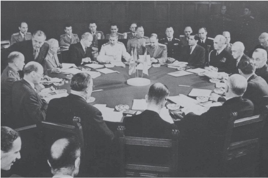
Stalin während der Rundtischgespräche auf der Potsdamer Konferenz 1945.

ab 1956 mit der Gründung der Bundeswehr wieder los! Aus der Verstaatlichung befreit, konnten die Aktionäre wieder auf dicke Profite aus ihrem Blutgeschäft hoffen. Heute hat der Konzern einen Umsatz von 5,6 Milliarden Euro.