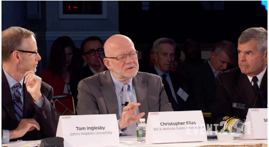
Die Pandemieübung Event201 vom Oktober 2019 simulierte den Ausbruch eines neuen Coronavirus, mit dabei Tom Inglesby vom CFHS und Christopher Elias von der BMGF, (Quelle: Screenshot Video Center for Health Securities)

Das Planspiel „Dark Winter“ — das sei hier am Rande erwähnt — stand im Übrigen in Zusammenhang mit den Anthrax-Anschlägen kurz nach 9/11. Die Liste endete zum damaligen Zeitpunkt 2020 mit dem mittlerweile berühmt-berüchtigten Event 201 [12], welches im Oktober 2019 abgehalten wurde und eine doch wirklich frappierende Ähnlichkeit mit dem aufwies, was der Weltbevölkerung ab Janu-