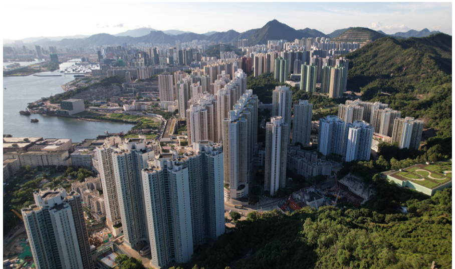
Kowloon Bay, Hong Kong (Standort Glorious Sun Group), am 22.8.2021

Wenn es um die Ausgabe von Aktien und andere Geschäftsangelegenheiten in den Vereinigten Staaten geht, hat „Glorious Sun“ die Dienste der „Bank of New York“ (jetzt BNY Mellon) in Anspruch genommen, einem Bankinstitut mit einer berühmten Geschichte [14] der Beteiligung an Geldwäsche und Kapitalflucht im Zusammenhang mit dem organisierten Verbrechen. „Glorious Sun“ selbst hat eine starke Präsenz in New York City bei-