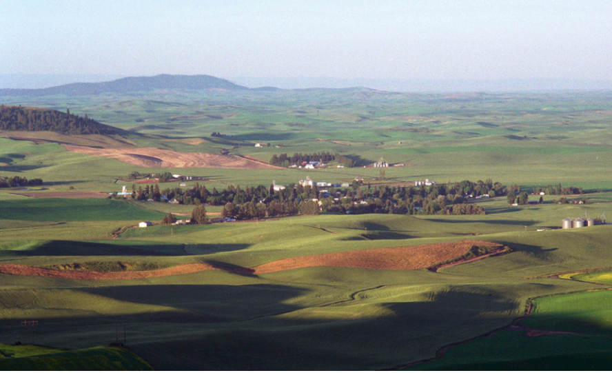
Farmington, Washington, am 1.7.2033