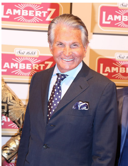
George Hamilton bei der Lambertz Monday Night, 30.1.2017

in verschiedene Banken auf dem chinesischen Festland und in Hongkong erfolgte.