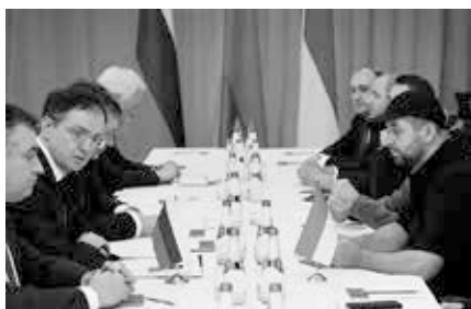
Denis Kireev (rechte Seite ganz oben), ukrainischer Unterhändler bei den Verhandlungen im Frühjahr 2023, wurde durch den ukrainischen Sicherheitsdienst SBU ermordet.

Der SBU verhaftet nun viele Zivilisten, denen er Kollaboration mit den Russen vorwirft.