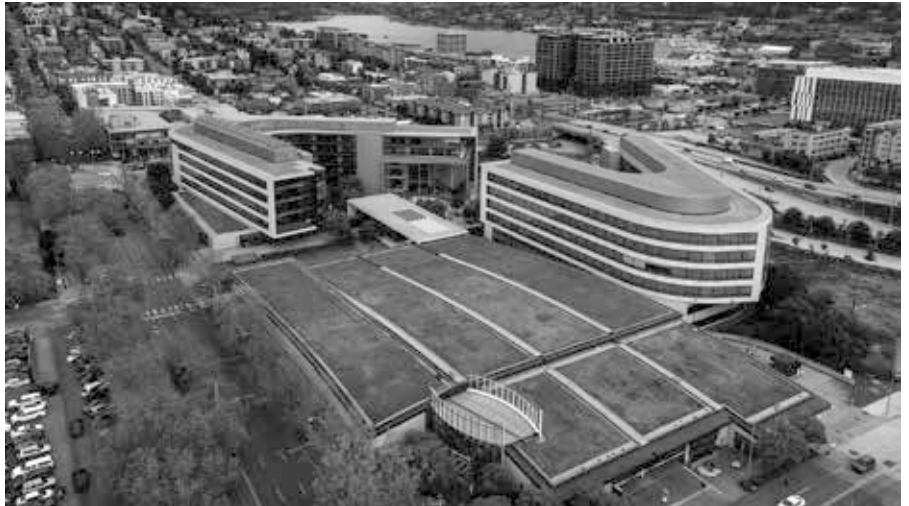
Das Gebäude der Bill & Melinda Gates Foundation, 28.5.2022

VIB ist Peter Piot [33], ein weiterer enger Mitarbeiter von Bill Gates und ehemaliger Covid-Sonderberater von Ursula von der Leyen [34].