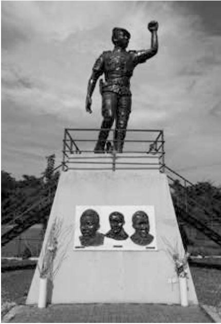
Statue Thomas Sankaras, ihm zu Ehren errichtet 2019