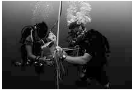
Sprengstoff-Entsorgungstechniker platzieren während der Übung Tricrab 2012 einen Unterwassersprengstoff auf einer simulierten Mine als Teil eines Minenbekämpfungsszenarios, 27.8.2012.

und begannen pflichtbewusst mit der Arbeit an dem neuen Problem – wie man die C4-Sprengsätze auf Bidens Befehl fernzündet. Es war eine viel anspruchsvollere Aufgabe als man in Washington dachte. Für das Team in Norwegen gab es keine Möglichkeit zu wissen, wann der Präsident den Knopf drücken könnte. In ein paar Wochen, in vielen Monaten oder in einem halben Jahr oder später?