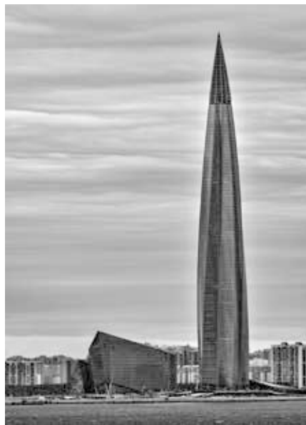
Gazprom-Turm (Lakhta Center) St. Petersburg, Russland, Mai 2020.

berater Jake Sullivan, Außenminister Tony Blinken und Victoria Nuland, die Unterstaatssekretärin für Politik – hatten ihre Feindseligkeit gegenüber den beiden Pipelines lautstark und konsequent zum Ausdruck gebracht. Diese verlaufen über eine Strecke von 1207 Kilometern parallel unter der Ostsee. Ausgehend von zwei unterschiedlichen Häfen im Nordwesten Russlands nahe der Grenze zu Estland, verlaufen sie nah an der dänischen Insel Bornholm vorbei, bevor sie in Norddeutschland enden.