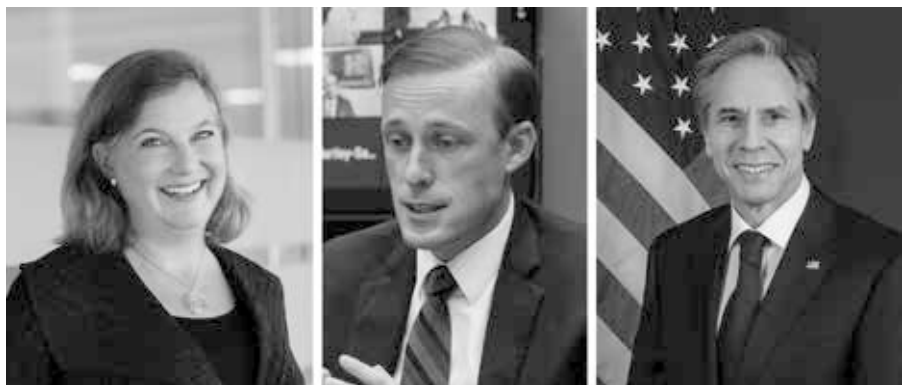
Die Beteiligten von links nach rechts: Victoria Nuland, Jake Sullivan, Anthony Blinken

Es sollte das erste einer Reihe streng geheimer Treffen sein. Sie fanden in einem sicheren Raum im obersten Stock-