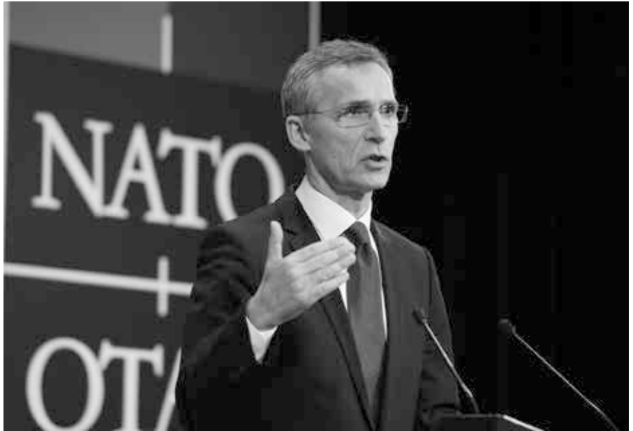
Pressekonferenz NATO-Generalsekretär Jens Stoltenberg, 5.2.2015.

Zurück in Washington wussten die Planer, dass sie nach Norwegen gehen mussten. „Sie hassten die Russen, und die norwegische Marine war voll von hervorragenden Seeleuten und Tauchern, die über Generationen an Erfahrung in der hochprofitablen Tiefsee-Öl- und Gasexploration verfügten“, sagte die Quelle. Auch ihnen konnte man vertrauen, die Mission geheim zu halten. (Die Norweger hatten möglicherweise auch andere Interessen. Die Zerstörung von Nord Stream – falls dies den Amerikanern gelingen sollte – würde es Norwegen ermöglichen, erheblich mehr seines eigenen Erdgases nach Europa zu verkaufen.)