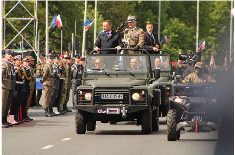
Foto von der Militärparade „Strong in Alliances“, die anlässlich der Feierlichkeiten zum 3. Mai organisiert wurde am 3. Mai 2019

Dieser Text wurde zuerst am 26.10.2022 auf www.theconversation.com unter der URL https://www.theconversation.com/poland-dreams-of-building-europes-largest-army-against-backdrop-of-russias-war-against-ukraine-192580 veröffentlicht. Lizenz: CC0