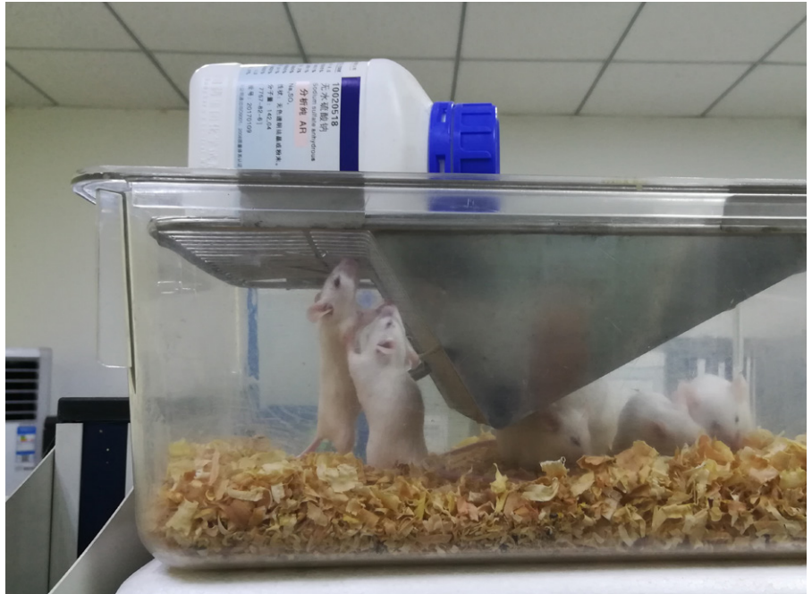
Laborratten; Symbolbild, gemeinfrei

Dieser Artikel wurde zuerst am 17.11.2022 auf caitlinjohnstone.com unter der URL https://caitlinjohnstone.com/2022/11/17/us-empire-views-ukrainians-and-russians-as-lab-rats-for-weapons-testing/ veröffentlicht, Lizenz: Caitlin Johnstone, CC BY-NC-ND 4.0