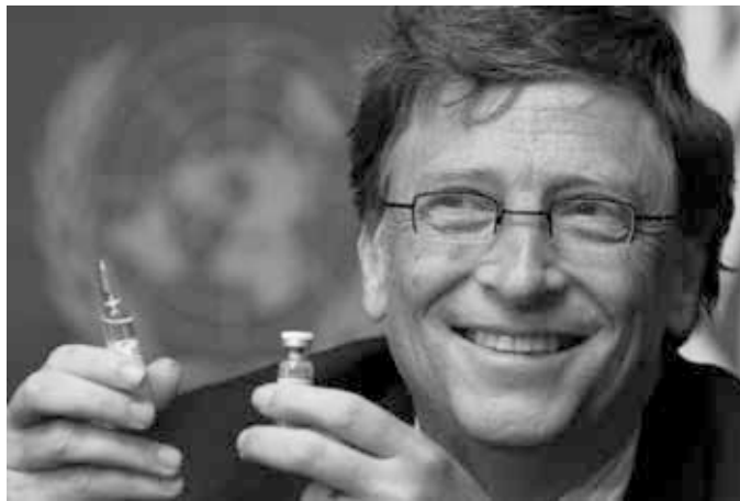
Pressekonferenz - Margaret Chan @ Bill Gates, am 17.5.2011

Die traurige Realität der westlichen Gesellschaften ist, dass in immer mehr politischen Fragen Scharlatane, selbster-